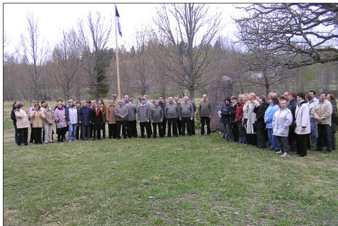
Mihkel Lüdigi Meeskoori, segakooride "Sireli" ja "Endla" ning naiskoori "Leelo" esituses kõlas 125. aastat tagasi pere seitsmenda lapse Mihkli sünni puhul istutatud tamme all avalauluna suure helilooja kuulsaim teos "Koit"