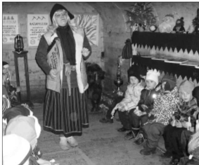
Jutumemm enda tehtud muinasjutte Tapa mudilastele vestmas.