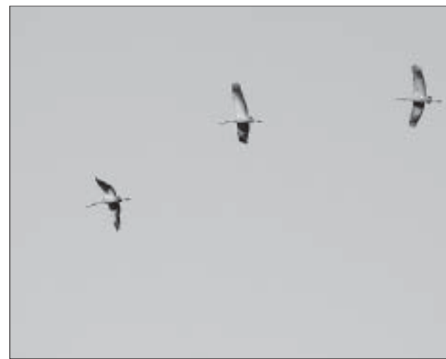
Sookured läevad..., kas kurjad ilmad tulekul?