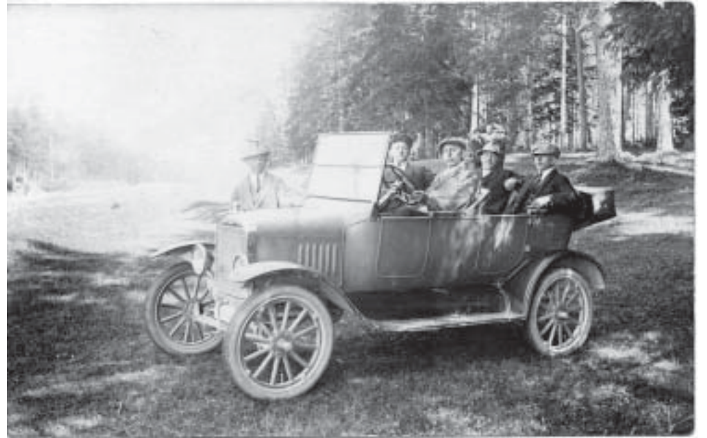
Piknik Liivamäel, 1929. aasta.

Tollase koolisüsteemi kitsaskohtadest esimene oli, et ei jätkunud õpetajaid. Polnud ju normaalne, et 6-klassilises algkoolis õpetasid tihti ainult 2 õpetajat. Koolisundus kehtis 1928. aastast ja hõlmas lapsi 8.-19. eluaastani. Paljud lapsed ei suutnud algkooli kuue aastaga lõpetada ja nii jäigi see paljudel lõpetamata. Enamasti oli põhjuseks, et sügisel hilineti koolitulekuga. Kes töötas talus palgalise karjasena, see pääses kooli teinekord alles oktoobri keskel, kuigi õppetöö algas 1. septembril. Sellised hilinejad olid