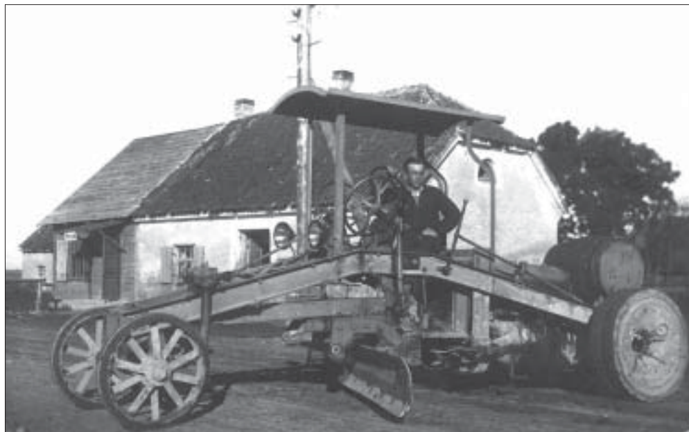
Teehõövel, 1930. aastad.

enamasti kehvematest peredest ja neid tabas tihtipeale ka mahajäämus teistest õpilastest ja sellega ka istumajäämine kevadel.