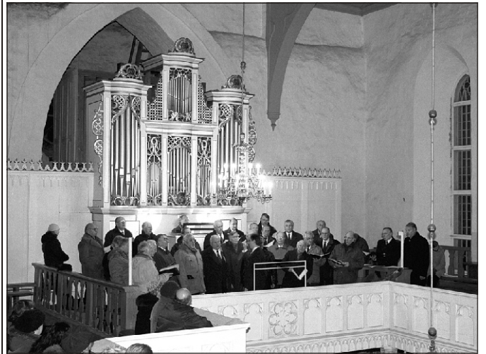
Tartu meeskoori Gaudeamus kontsert Suure-Jaani kirikus