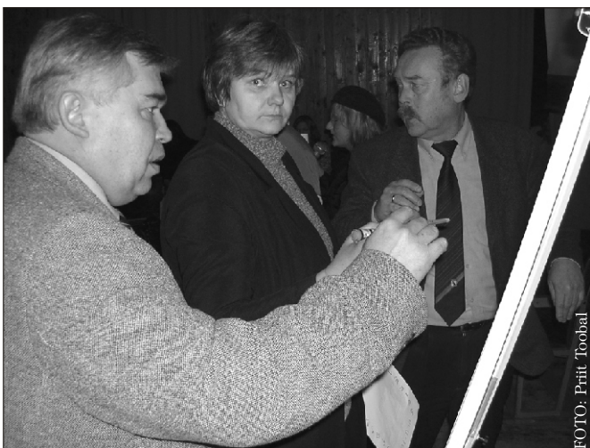
Piirkonna omavalitsusjuhid harjutasid Noortetrallil koostööd