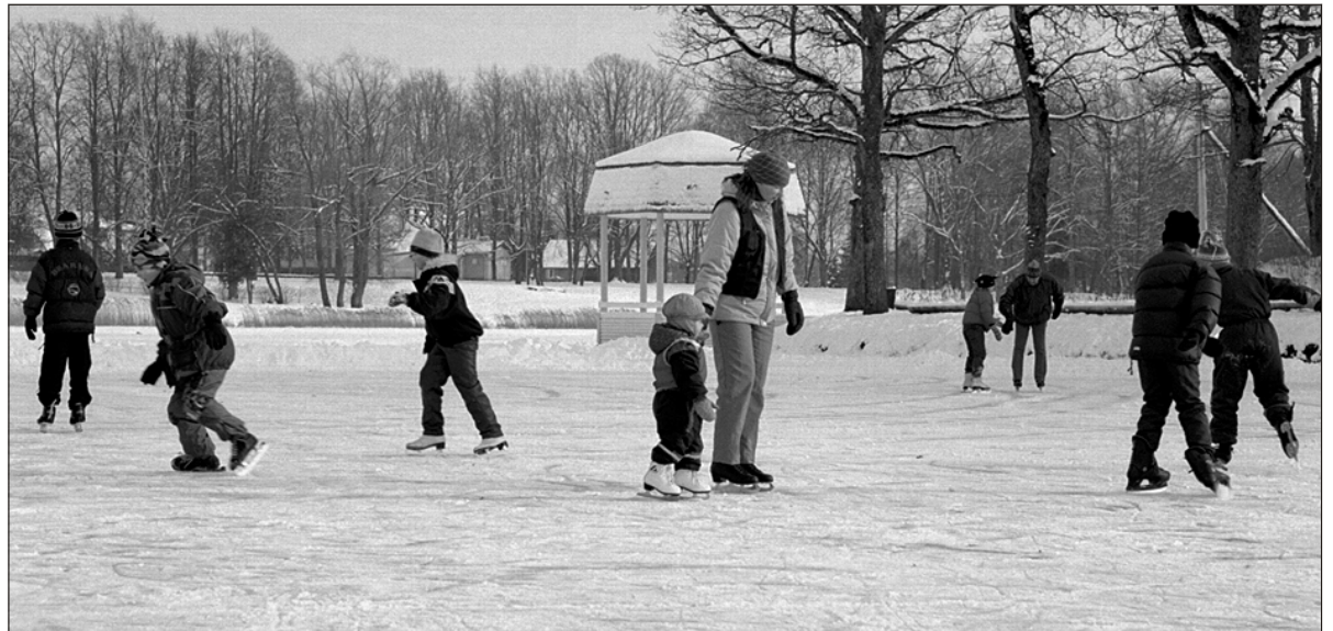
Ilusaid talveilmu ja mõnused naudivad Suure-Jaani järvel nii väikesed kui suured uisutajad.