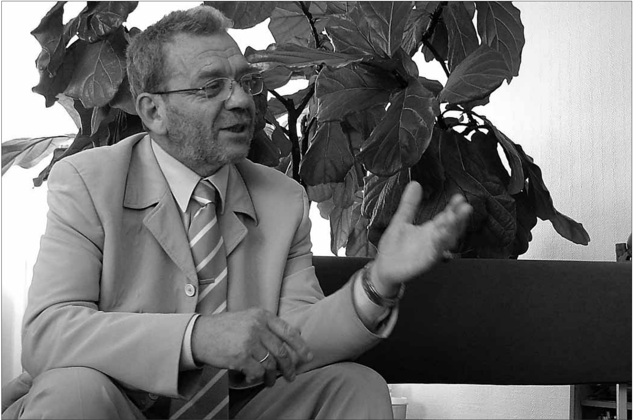
Kiili vallavanem Vambo Kaal räägib vallavalitsuse ees seisnud probleemidest.