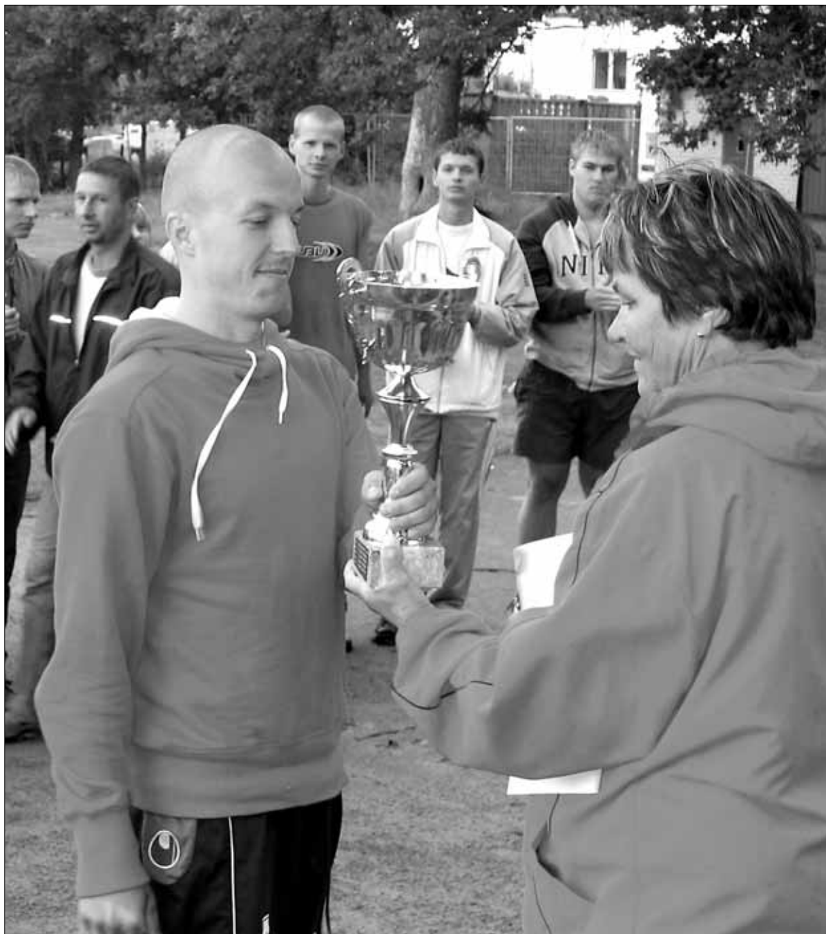
Võitjavõistkond karikat vastu võtmas.

Osavõtt oli väga aktiivne ning parematele oli välja pandud ka auhinna nagu ka iga võistkonna parematele mängijatele ning turniiri pare-