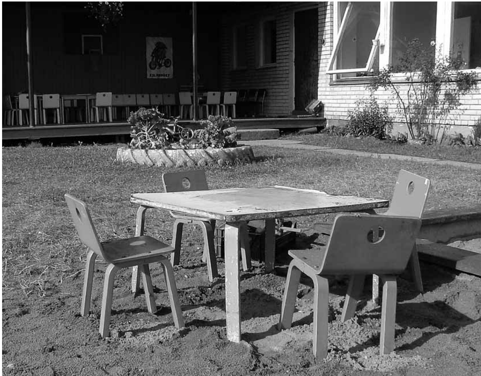
Laste rännak algas Kiili lasteaia ja viis kaheksa kilomeetri kaugusele Piissoo külla, kuhu jõudes neil otsingutel osalenud Falcki patrull vastas oli.