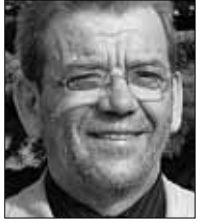
Vambo Kaal vallavanem

Kohalike omavalitsuste volikogude valimised on kohe-kohe kätte jõudmas. Pisut alla kuu aja on Eestimaa elanikel aega valida kandidaatide hulgast välja inimesed, kelle juhtimise ja hoole alla nad oma kodukandi saatuse järgmisteks aastateks usaldavad. 43 inimest alustavad Kiili vallas võidujooksu 13 volikogu koha pärast.