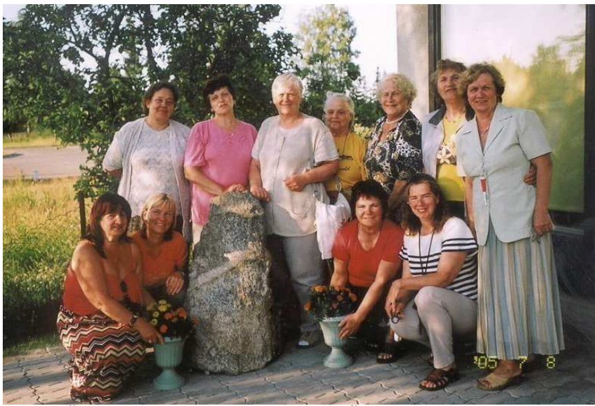
FOTOMÄLESTUS KULTUURILOOLISEST RÕNGUST : Grupp laagrilisi Rõngu raamatukogu kivi juures.

Hommik algas tõeliselt suurte lindude – jaanalindude – elu ja käitumise jälgimisega Ants Karro ökotalus. Nauditav elamus oli silitada jaanalinnumuna ning kinnitada ilus sulg kübarale või rinda.