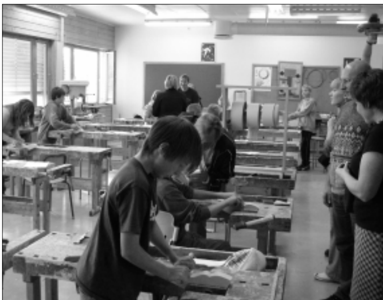
Tööõpetuse tunnis meisterdasid poisid-tüdrukud usinalt üheskoos.