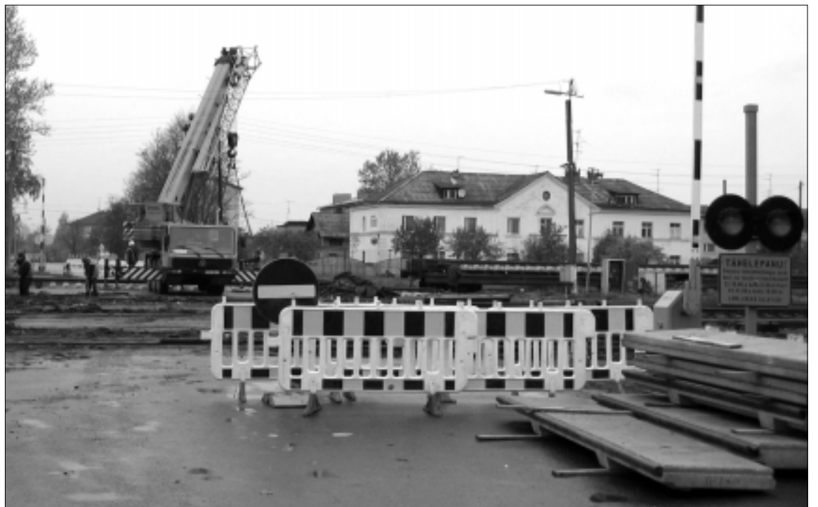
Tapal paiknev raudteeülesõit on remondis 23. oktoobrist kuni 1. novembrini.