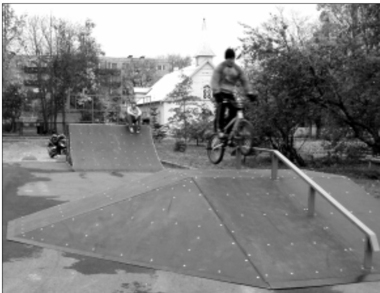
Esimesed trikitajad olid kärsitult ootamas juba enne rampide lõplikku paigaldamist ning sööstisid kohe platsile, kui luba oli antud.