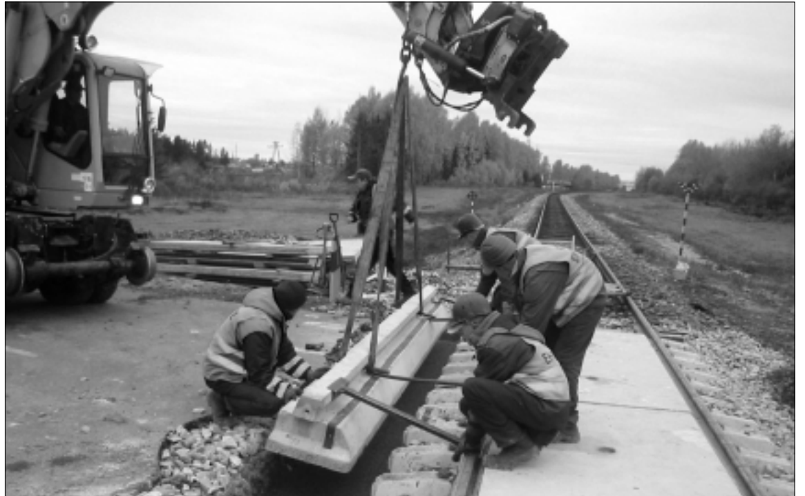
Moe raudteeülesõidul käisid remonttööd 16. oktoobril.