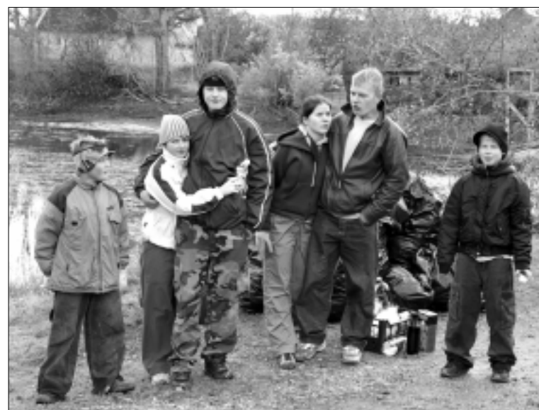
Talgulised pärast tõhusat tööpäeva Vahakulmu paisjärve kaldal.

Kõik, kes virisevad, et ei jõua või ei saa midagi teha oma kodukoha looduse heaks, siis siin on teile ere näide noortest, energilistest ja teotahelistest inimestest, kes tõestasid vastupidist. Üha rohkem tundub mulle, et paljud asjad jäävad meil tegemata just inimeste oma laiskusest, mugavusest või mõttelõtvusest. Lihtsam on ju süüdistada teisi ja näidata näpuga kasvõi vallavalitsusele. Kas pole siis nii? Vajalge