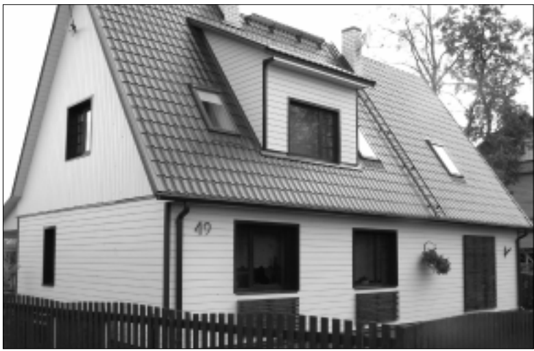
I preemia saanud maja Pikal tänaval.