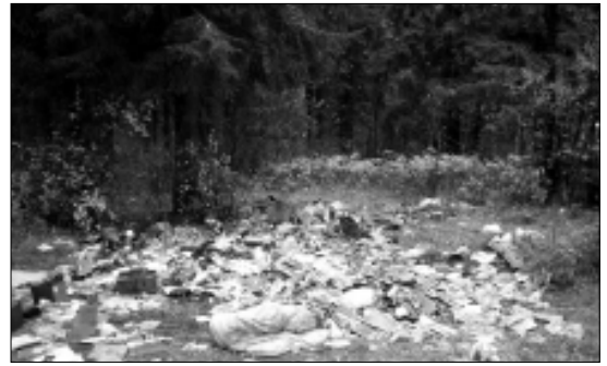
Rotimetsa alla on veetud sügisel mitu autokoormat koristusprahi. Koristajad on jätnud samasse ka oma visiitkaardid, millelt võib lugeda aadressi Ambla mnt 24-21. Linnavalitsus taotleb politseiilt süüdlaste korraldusumist, reostuse likvideerimist ja karistamist.