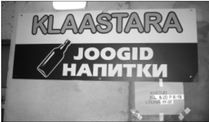
Kunagise maapanga ruumides avati oktoobri alguses jookide kauplus. Sildilt võib lugeda, et seda ümbritseb "klaastara". Kunstilise kujundusega kaupluse seinal olev reklaam küll ei hiilga.