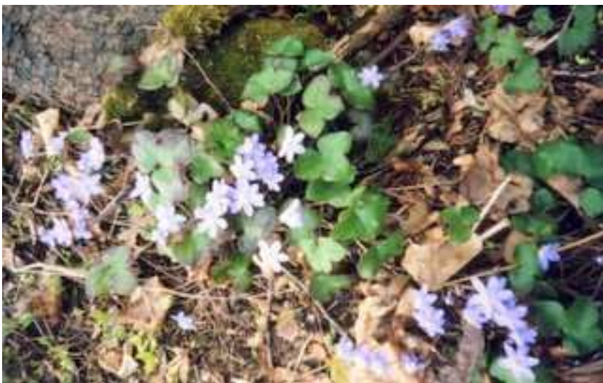
TASUB TEADA: Rahvatarkuse varasalves on hoiatav tõdemus, et kui külm kevadel õied ära võtab, siis võtab ta sügisel vilja ära.