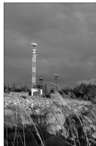
Interneti-signalide saatja paikneb Jumindal kordoni radarijaama mastis.

Neil, kel internetiühendus juba olemas, olemasolev (tehnikas) säilib. Odamamaks muutub vaid ühenduse hind. See saab olema samuti kuni 450 krooni.