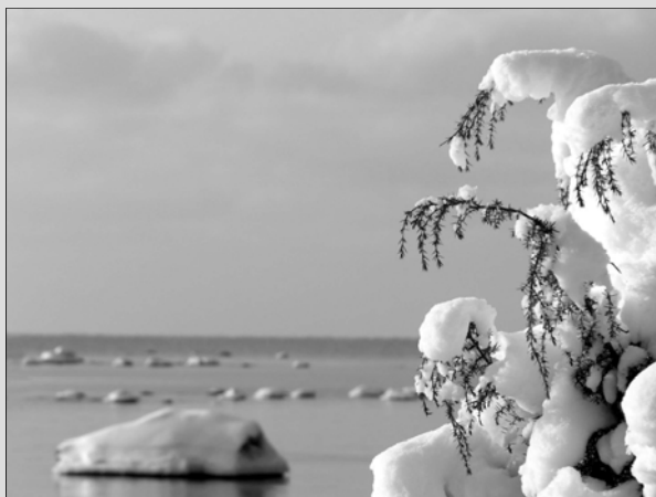
Lumised kadakad Kura rannas.

teise jõudes moondunud või oma algse sisu kogunisti minetanud on. Külajutud teeb võimalikuks selle, mis siiani võimatuna näinud – viib külajutud igasse peresse ja majapidamisse otse algallikast.