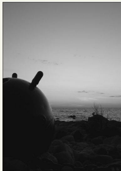
Meremiin Juminda neeme tipus.