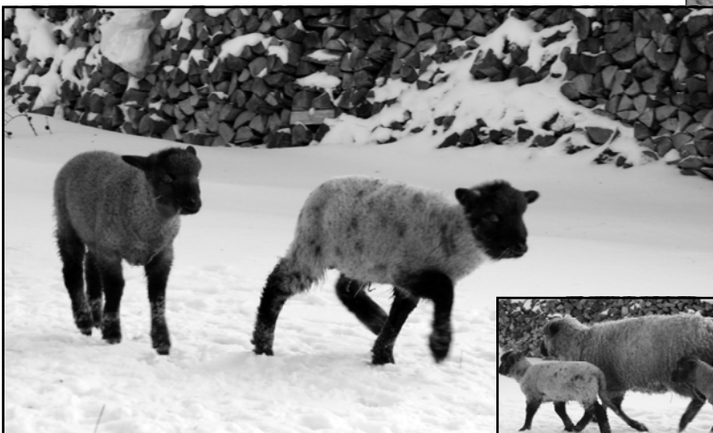
Detsembris sündinud kaksikud talled.