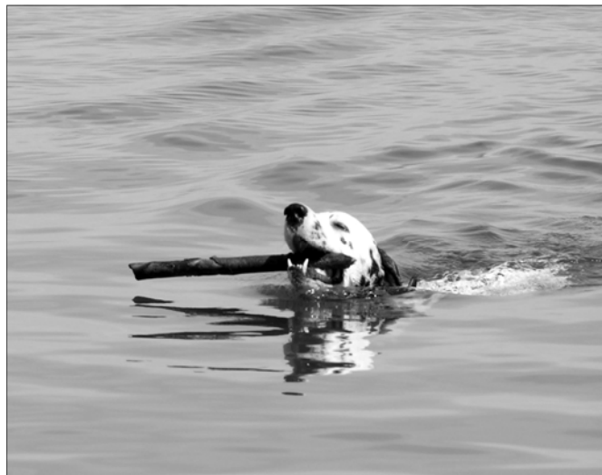
Üle kõige meeldib Dandyle mere ääres mängida.