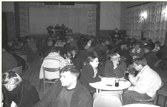
Mälumäng Kolgaküla rahvamajas aastal 2004.

Aastaid sarjas edukalt esinenud ja alati ka tuge-