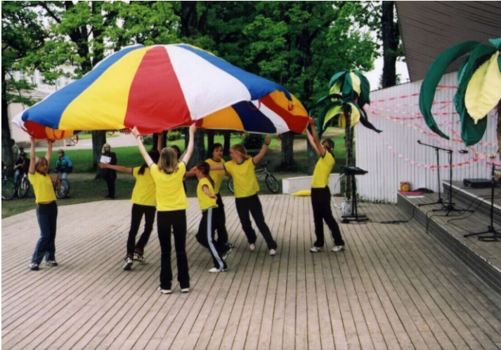
Reet Mutso võimlemisrühm esinemas sambakarnevalil. Sama kava kogus tunnustust ka kevadpeol.