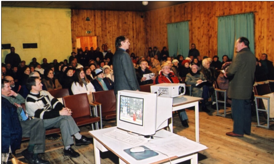
Linnavalitsusel õnnestus manada enamiku kuulajate silme ette just selline pilt, nagu ametnikud soovisid. Effektselt abiks oli seejuures tehnika viimane sõna.