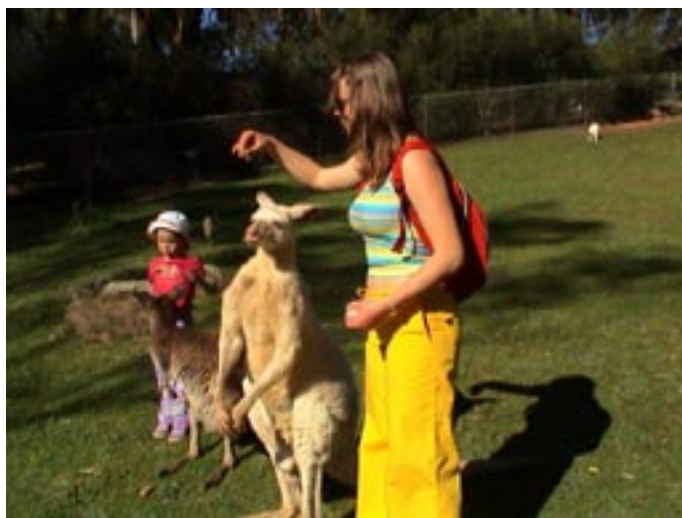
Vlada saab hästi hakkama nii pikkade kangurudega ...