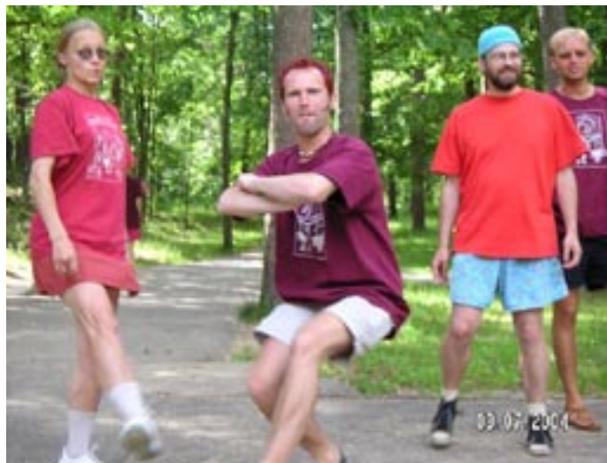
Rahvatantsuga tegelemine aitab vormis püsida.