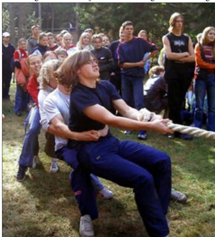
Köieveos tuli klassidel viimanegi võidu nimel välja panna.

Pikniku lõpp saabus märkamatult kiiresti. Viimane köietõmme tõmmatud ning juba asutigi teele kümne bussi poole, mis peagi väljusid ja tublid ning pisut kurnatud treffneristid Tartusse tagasi toimetasid. Ka päike pugus ühtlaselt halli pilvetekikese taha ja taevast hakkas sadama uduvihma. Mälestus toredast piknikust aga püsis õpilaste südameis veel päevi hiljemgi, tõi naeratuse näole ja pani silmad tunnis särama. Ei jää muud üle, kui oodata järgmist sügist, järgmist piknikku looduse rüpes.