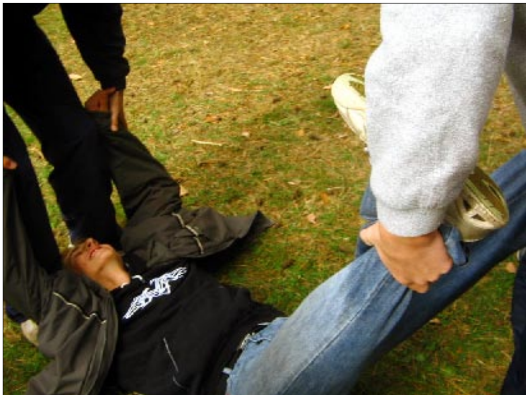
Viimased venitusharjutused võistlusteks.

Pärast pikka ootamist jõudis kätte teisipäev. Treffneristid kogunesid ühel meelel Vanemuise alumisse parklasse, kus ootasid kümme toredat bussi veel toredamate bussijuhtidega. Kummirattalised tõllad sõidutasid õpilased Taevaskotta, kus paari pilve tagant paistis soe päike ning õhk oli meeldivalt karge. Ees ootasid juba