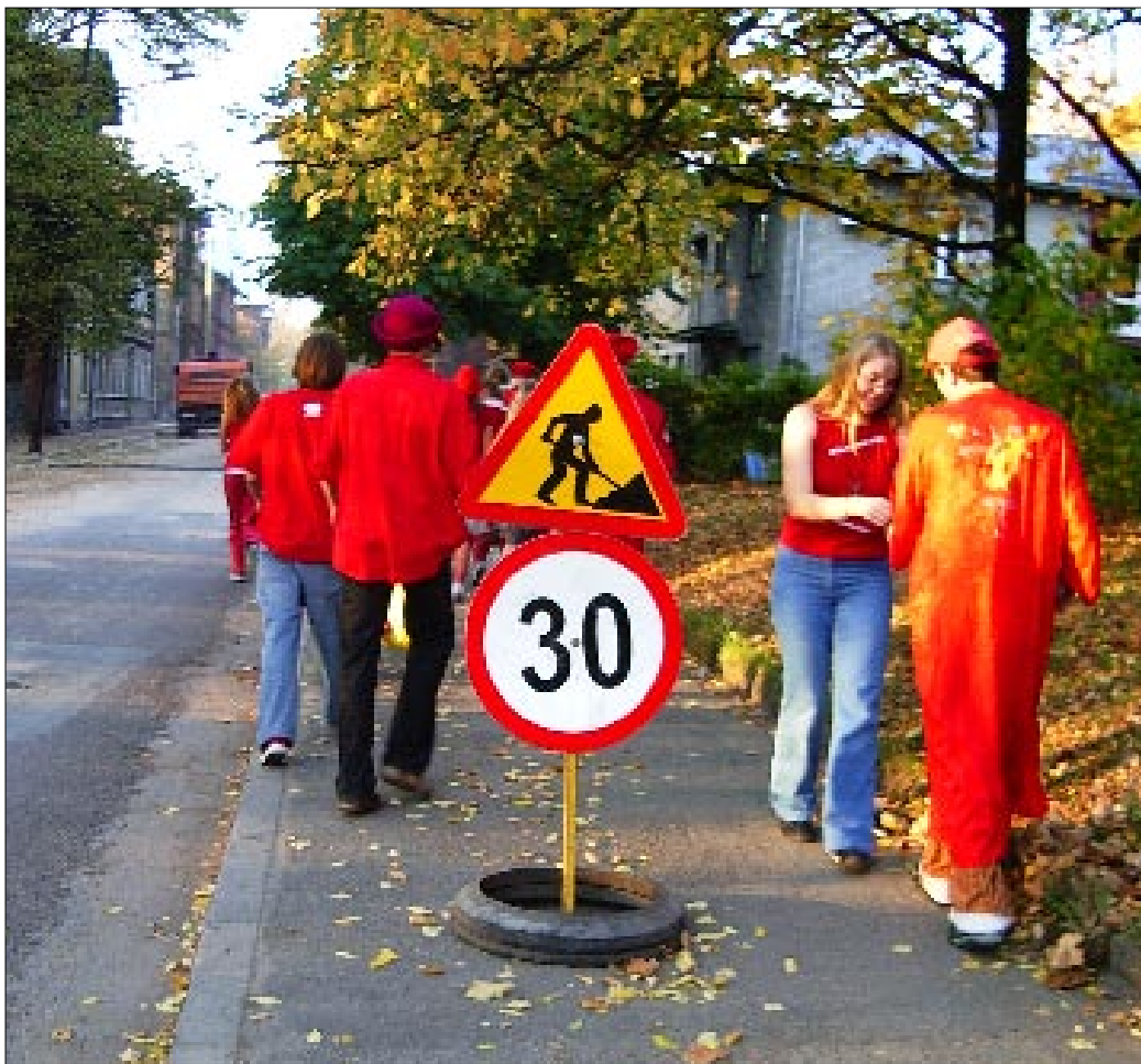
Esialgu kehtivad rebastele ohutuse mõttes koolis liiklemisel kiiruspiirangud.