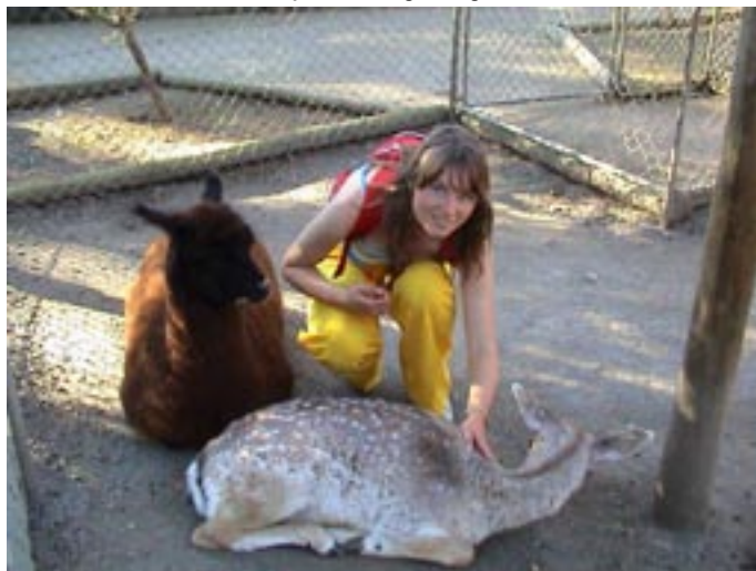
... kui ka häbelike sõralistega.