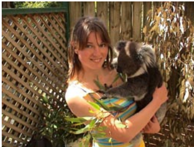
Uskuge või mitte, see on ikka päris koala.

Austraalia loomastik ei jäta ükskõikseks ühtegi eurooplast. Vladagi kasutas võimalust teha lähemat tutvust eksootiliste elukatega.