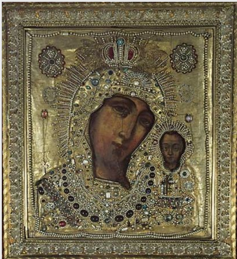
KAASANI JUMALAEMA IKOON (8. juuli)