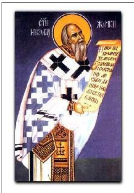
Püha Serbia Nikolai