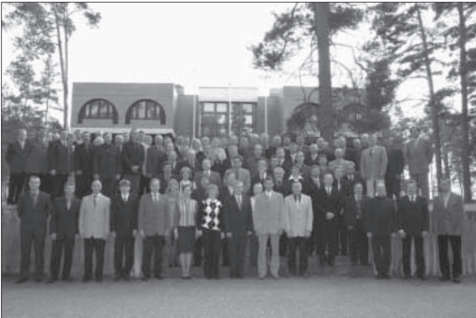
Metsaülemate päevadest osavõtjad Valgerannas villa Antropoff ees.