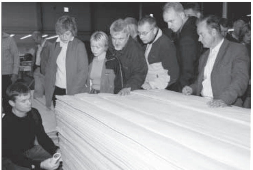
Spoonitehases Valmos tutvutakse kase spooni valmistamisega.

Päästeamet tegeleb alates 1995. aastast metsatulekahjudega. Reageerimine on kiirem, kuid kahjaks toimuvad samal ajal ka teised õnnetused.