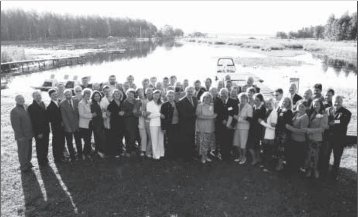
Balti metsaseltside kohtumisest osavõtjad.

Konverentsi teemaks sel aastal oli „Metsade kaitse. Hädaolukordadega – tormi ja tulekahjudega - tegelemise süsteem”. Tavapäraselt anti konverentsi alguses ülevaade metsakaitse süsteemi olemusest ja toimimisest kolmes Balti riigis. Ettekannetes keskenduti erinevatele seadusandlikele aktidele ja organisatsioonilisele ülesehitusele metsakahjustustega tegelemiseks. Selgelt joonistus välja ja tekitas palju küsimusi Eesti metsakaitse süsteemi erinevus Läti ja Leedu metsakaitse süsteemist. Lätis ja Leedus on nii kahjustuste kui ka tulekahjude ennetamine, avastamine ja likvideerimine riigimetsasüsteemi ülesanne.