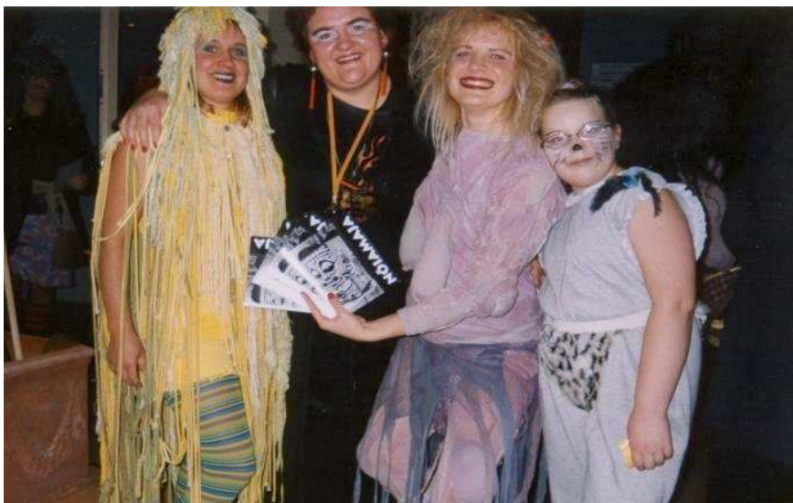
TEADJANAISED: Tartu Maanaiste Liidu kutsel kogunes Tartu vallamajja 29. oktoobri õhtul väga omapärane seltskond – oli murueide tütreid, oli mustlasi...

Kõik külalised võeti vastu sooja kallistuse ja pisikese nõialiku kingitusega.