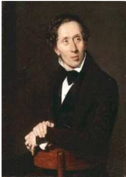
TÄHELEPANU KESKMES: Tuleval aastal möödub muinasjutuvestja Hans Christian Anderseni sünnist 200 aastat.

*töö autori ees- ja perekonnanimi, klass;