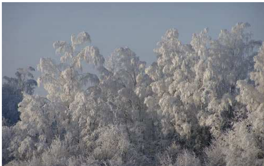
JÕULULUMMUS: Tuul oksid keerutab, neilt lumi langeb maha – on jälle talve alguspäev, taas täis on aastaring, kas tahad või ei taha...

Virve Tamm Laevast valiti kolleegide poolt parimaks lk 2