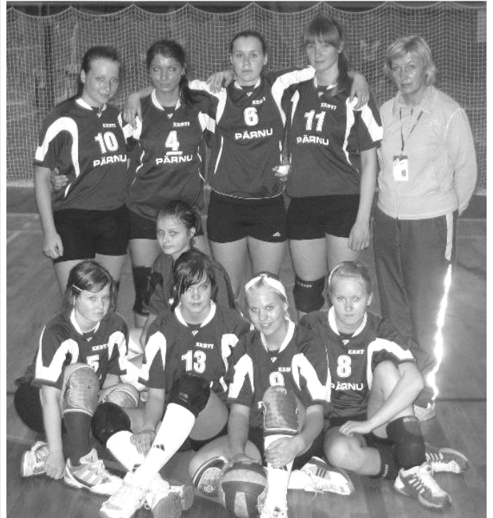
Koidula võrkpallitüdrukud tulid Horvaatias 27. kohale.