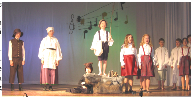
Pildike etendusest "Karjapoiss on kuningas"

Kuna sel aastal on Lümanda koolil juubeliaasta, siis toimus II poolaastal mitu koolile pühendatud ettevõtmist. Juubeliürituste sarja avas kooli sünnipäev jaanuaris. Järgnes Lümanda kooli 110. aastapäevale pühendatud õpioskuste olümpiaad III veerandi viimasel päeval, kus iga ülesanne oli kuidagi seotud Lümanda kooliga. Kolmandaks toimus õpilastele omaloomingukonkurss "Minu kool", millest võis osa võtta nii kirjutise kui joonistusega.