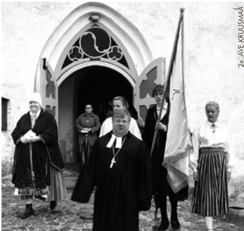
2x - AVE KRUIUSMAA