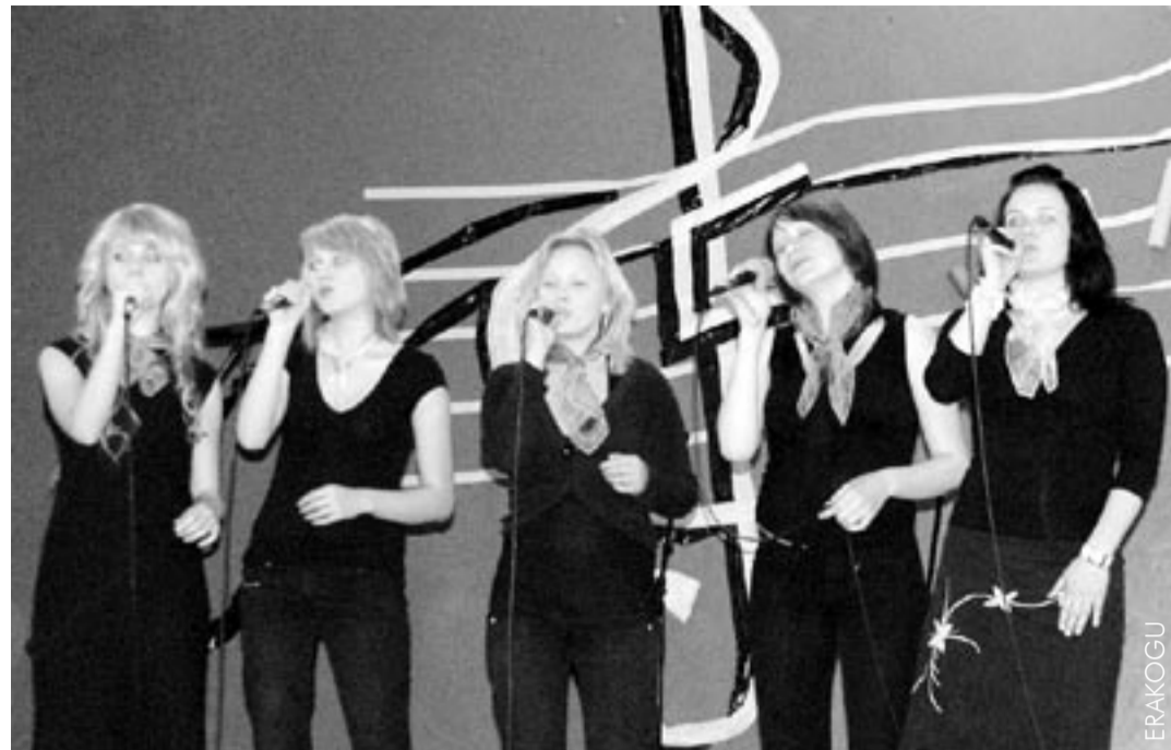
Konkursi parim ansambel oli Viljandi Muusikakooli Stuudio.