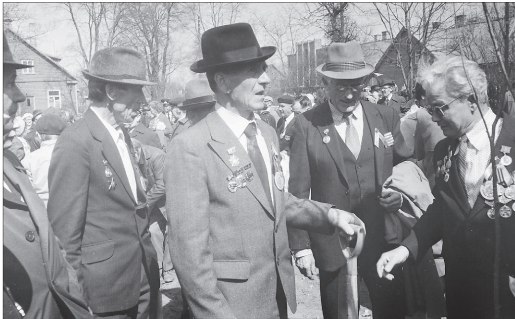
Labidate ja puuistikutega relvastatud aurahades mehed asutavad ennast Raplat ilusaks looma...

Vahel imestan selle üle, kuidas päris lähimineküla asjad rahva meelest ununevad. Üks asi, millest tahtsin rääkida, oligi see T-Raadio putka lugu. See ei olnud algselt üldse mitte tavaline miilitsaputka, sest nii uhkeid hooneid ju miilitsale kusagil mujal polnud. See ja mitmed teisedki Pärnu-Tallinna maanteel ehitati spetsiaalselt 1980. a Tallinna purjeregati väliskülaste jälgimiseks. Kui mõni juhtus seda teed sõitma, siis anti ta n-ö käest kätte. Teatati järgmisele postile, et selline masin läks läbi ja seal siis kontrolliti, kas saabus õigel ajal või põikas kuhugi sisse. Selline värvikas fakt väärinuks märkimist.