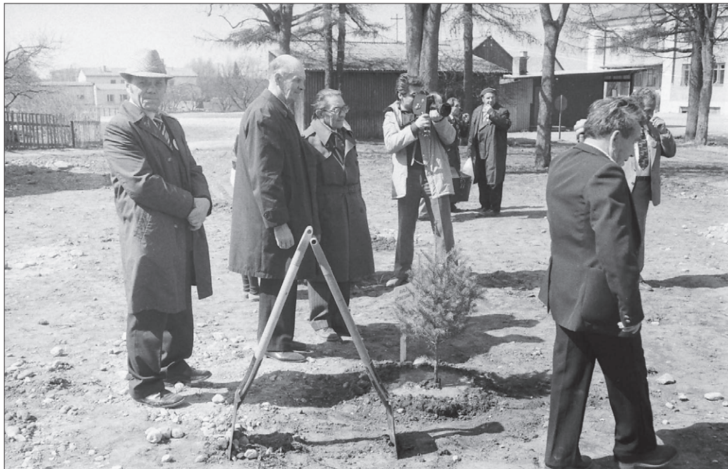
...ja Veteranide park ongi sündinud. Taasiseseisvuvast Eestist ei tea keegi veel mitte midagi, täpselt samuti nagu tolles uues Eestis ei mäleta keegi enam pargi sünnilugu. Niisugune on elu ja nii lühike seda saatev mälu...

Vaatame, mida sel puhul kirjutas kohalik leht Ühistöö. 14. mai 1985: "9. mai hommik saabus päikesepaistelise ja soojana. Selliseks jäi kogu päev, just nagu võidupüha pidamiseks loodud.