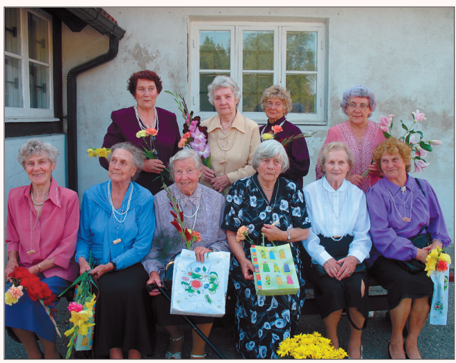
Ansambel Kodukolle oma 20. aastapäeval.