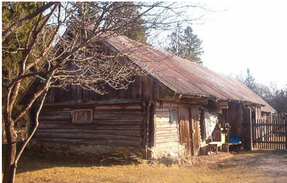
Vainu (Kase talu) vana ait on säilinud eheda näitena tollasest taluarhitektuurist.