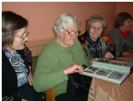
Vanad albumid ergutavad mälestusi.