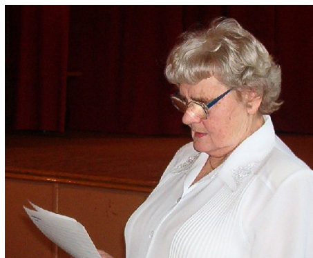
Esta Jõeste ülevaadet esitamas.