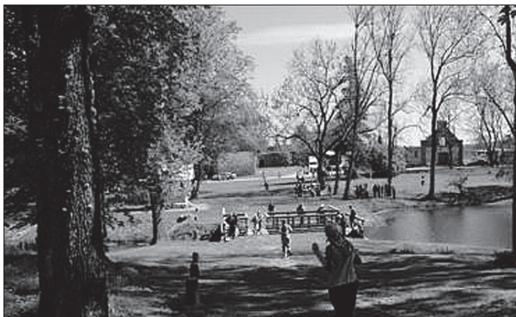
• Tartumaal Luke mõisa pargis.