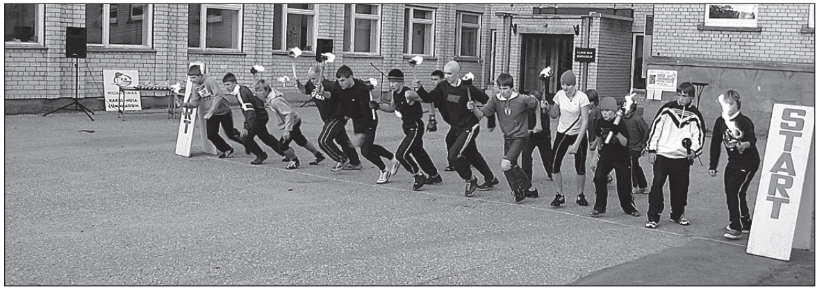
• Kooli sünnipäeva tähistatakse tõrvikutega teatejooksuga.

Onnitlen kooliperet, endisi õpetajaid ja vilistlasi kooli 50. aastapäeva puhul ning soovin edu ja kordaminekuid järgnevateks aastateks!