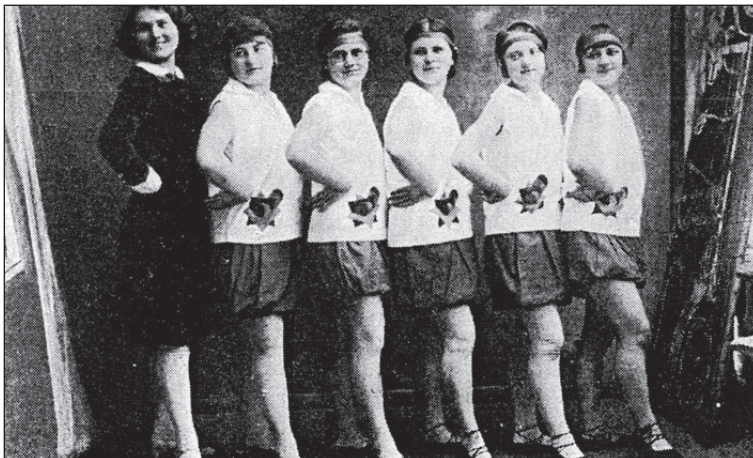
• Naisõpilaste tantsutrupp.

Et ajakirjast midagi välja ei tulnud, võeti kasutusele kirjakast. Seda varianti oli arutatud "Vao" koosolekul juba 1922. aasta novembris. Kirjakasti kasutati vahelduva eduga. Jaburate küsimuste hulgas oli ka asjalikke ja huvitavaid küsimusi ja ettepanekuid. Siit võeti teemad referaatide õhtule, arutleti teemasid usust, rahvusest, kodumastusest, omariiklusest, perekonnast, rahvaluulest ja maamajandusest. Vaidlusi peeti ka juhuslikel teemadel, mis saadi kohe ümbriku avamisel. Koosolekutel kõneldi veel peoõhtutest, kohtumistest teiste koolidega, ekskursioonidest,