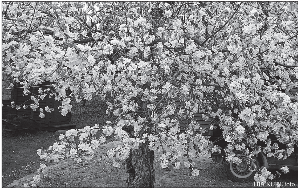
TIIDA KUKE foto