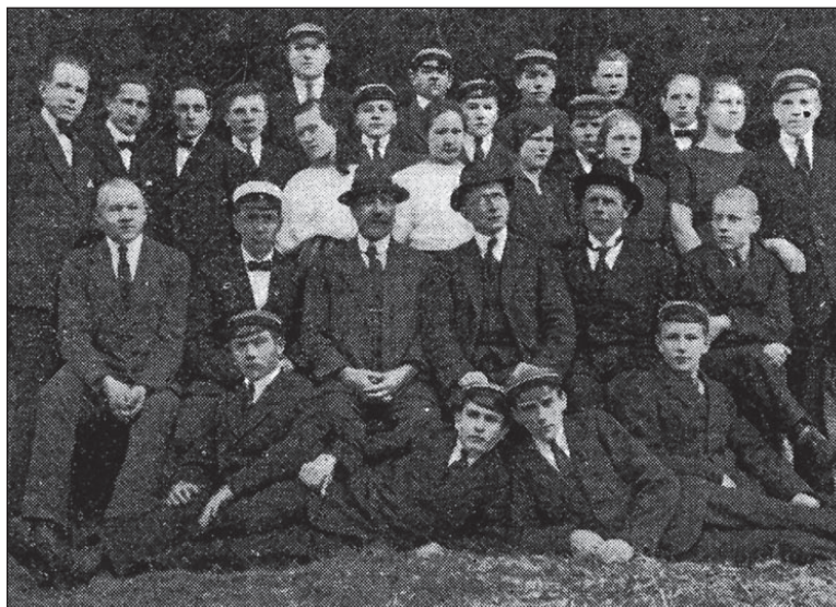
• Polli õpilased ja õpetajad 1923. aastal.