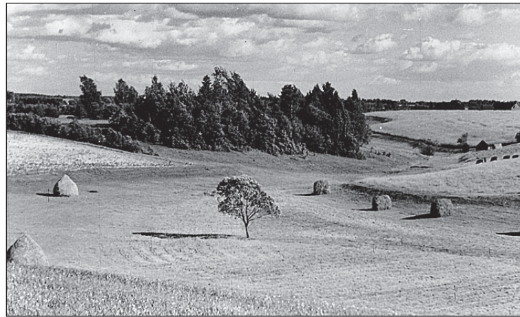
• Pöõgle heinamaa tulevase järve põhjas "Edu" kolhoosi maadel juulis 1955. Järv paisutati 1950. aastate lõpul ja 1960. algul, kui mõisa viinakoja juures kindlustati tamm.

Suurte ootuste aeg oli alanud. Ivi Harju