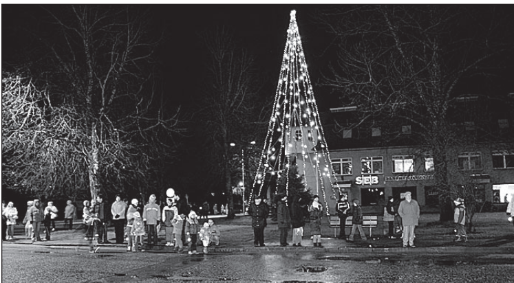
• Seekordsel jõuluajal meisterdati vallakeskust ehitma iselaadne jõulupuu — 15 meetri kõrgune, värviliste elektripirnidega kaunistatud püramiidjas metallist karkass. Tehiskuse püstitasid "Iivakivi" meistermehed.