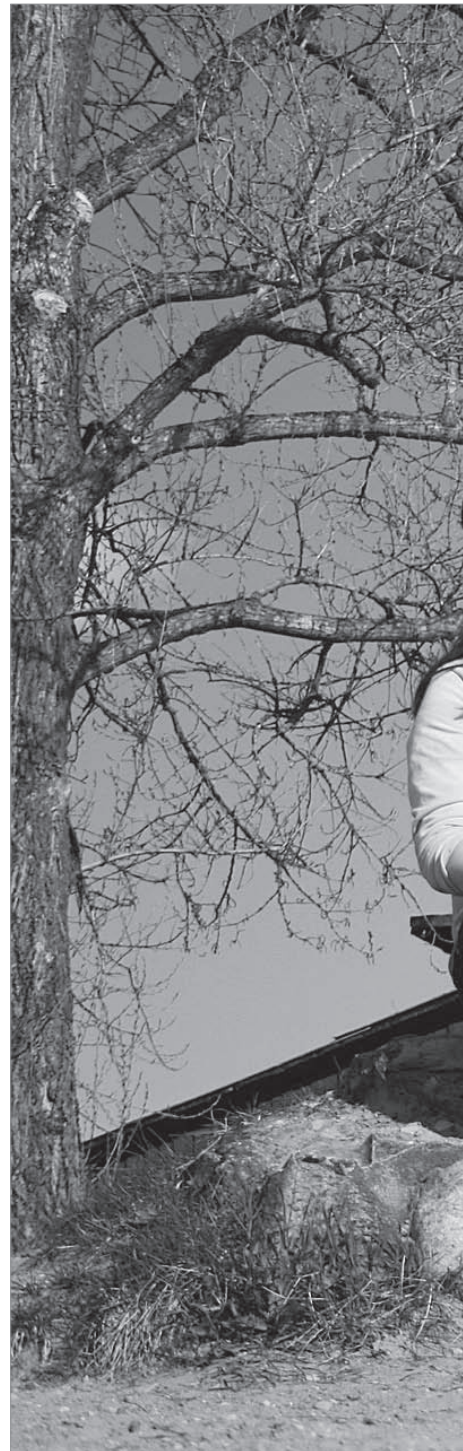
NOORÕ' TARTOH: seto noored on ülikoolilinnas

võtta' ütest uma valla ja ütest üle Setomaalitsõ üritusõ kõr- raldamisõst. Mullõ miildüs, ku nooril om suuv ja valmis- olõk anda uma osa Setomaa edenemisõ. Tahasi, öt tä tee- si' pingutusi tuu jaost, öt Seto- maalõ tūükotusit saia'. Olõ-õi tähtis, öt s'oo kokko lääsi opit erialaga. Elo muutus kipõstõ ja õks tulõ mano oppi'. Tähtsä om ülikooliaignõ tegevüs. Tulõ löüdä' aigu Seto Noori Seltsi jaost — s'oo om mi saatkond Tartoh. Ku õks ütelegi Seto- maa sündmüsõlõ jõvva-ai, sis om nätä', öt kandidiirminõ oll