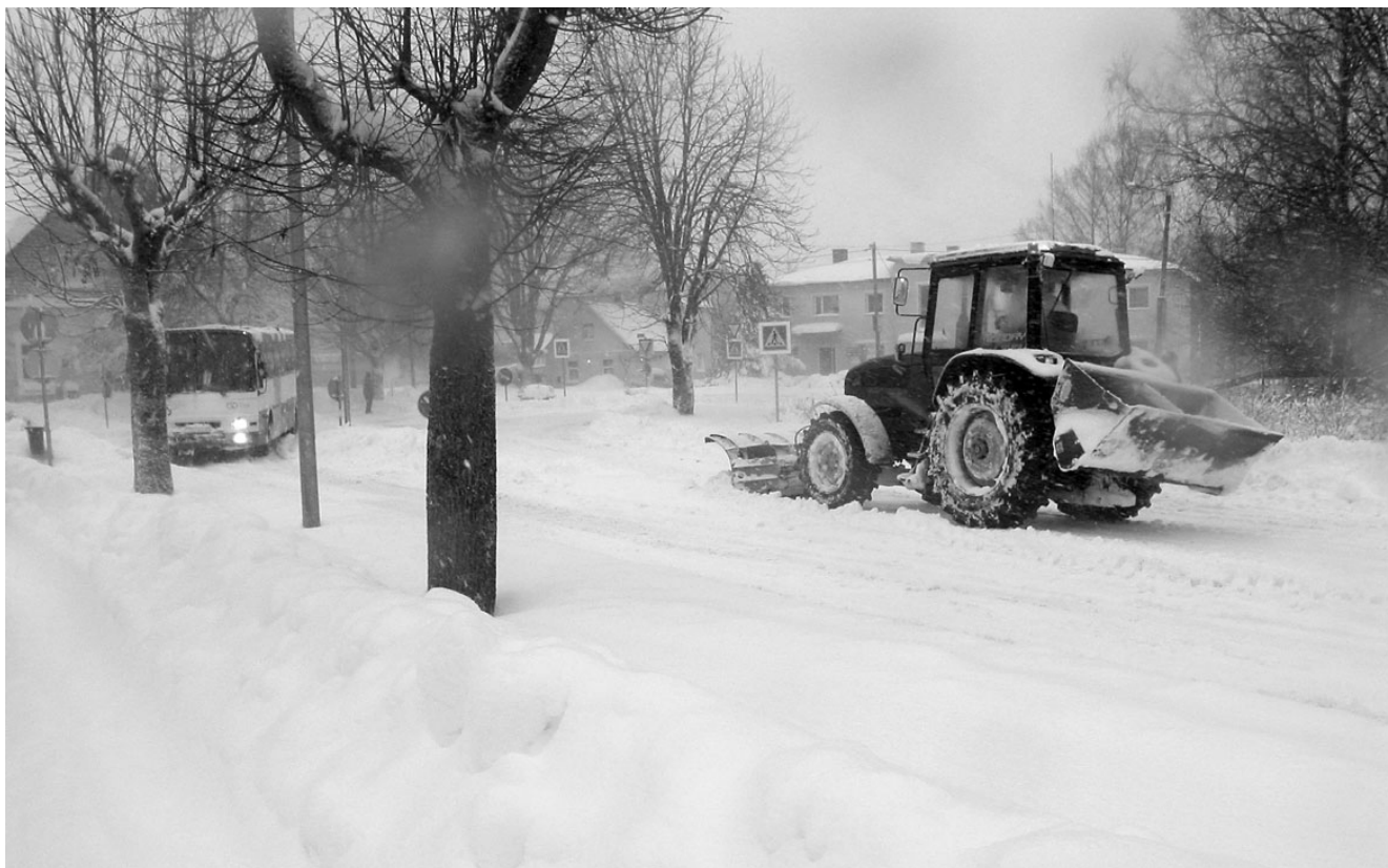
Need pildid, mis tehtud esmaspäeva hommikul Elvas, sobiksid ükskõik millise Eestimaa paiga lumeolude kirjelduseks. Eks lumerohkus on hea seni, kuni see ei hakka segama tavapäraselt elurütmi.