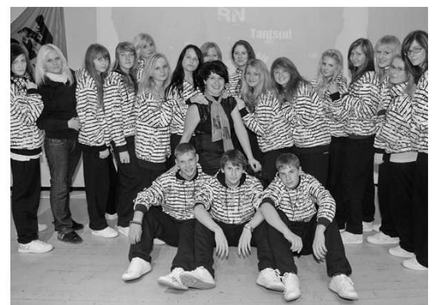
Tantsutrupp RN koos juhendajaga.