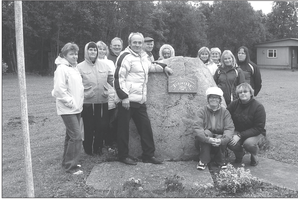
Türi valla külaliikumise komisjon käis ideid kogumas Kuhjaveres, mis tunnistati Aasta külaks 2007.

Peale pidevate kohapealsete tegemiste ja organiseerimise käiakse 2-3 korda aastas ekskursioonidel uudistamas, mida teevad teised külad nii kodukamara kui raja taga. Traditsiooniks on saanud ühine pühapäeva pidamine. Aeganõudvaks on kujunenud ka huviliste ja külalistega tegelemine. Pärast meid oli samal nädalal tulemas veel kaks teadmishimulist seltskonda.