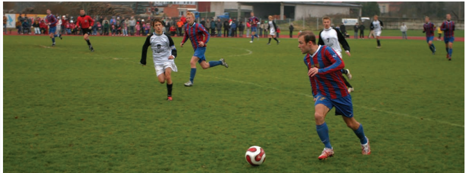
Paide pallurid võitlesid end poodiumile.