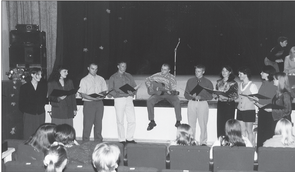
Foto aastast 1998. Vastloodud ansambli esimene ülesastumine Retla kooli sünnipäeval.