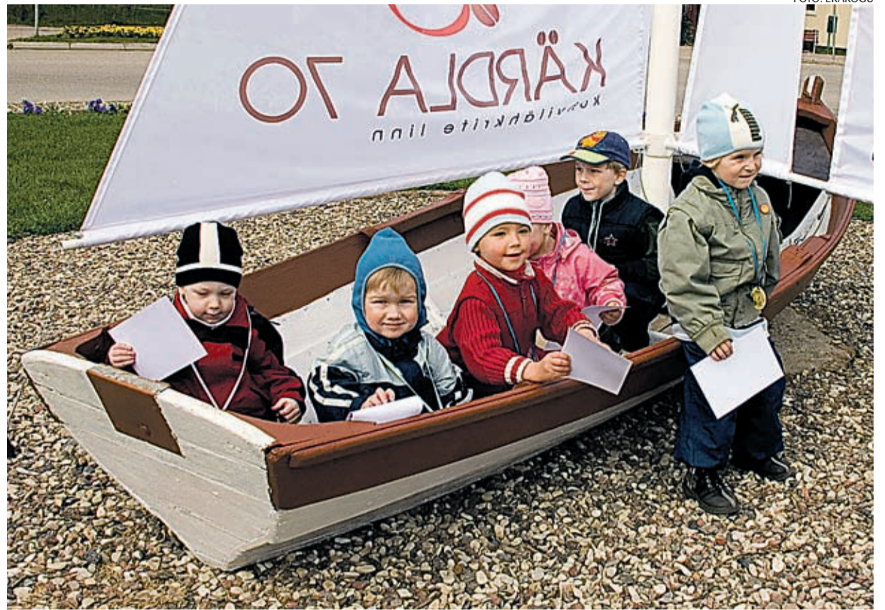
Kärklas pööratakse lastega peredele tähelepanu.