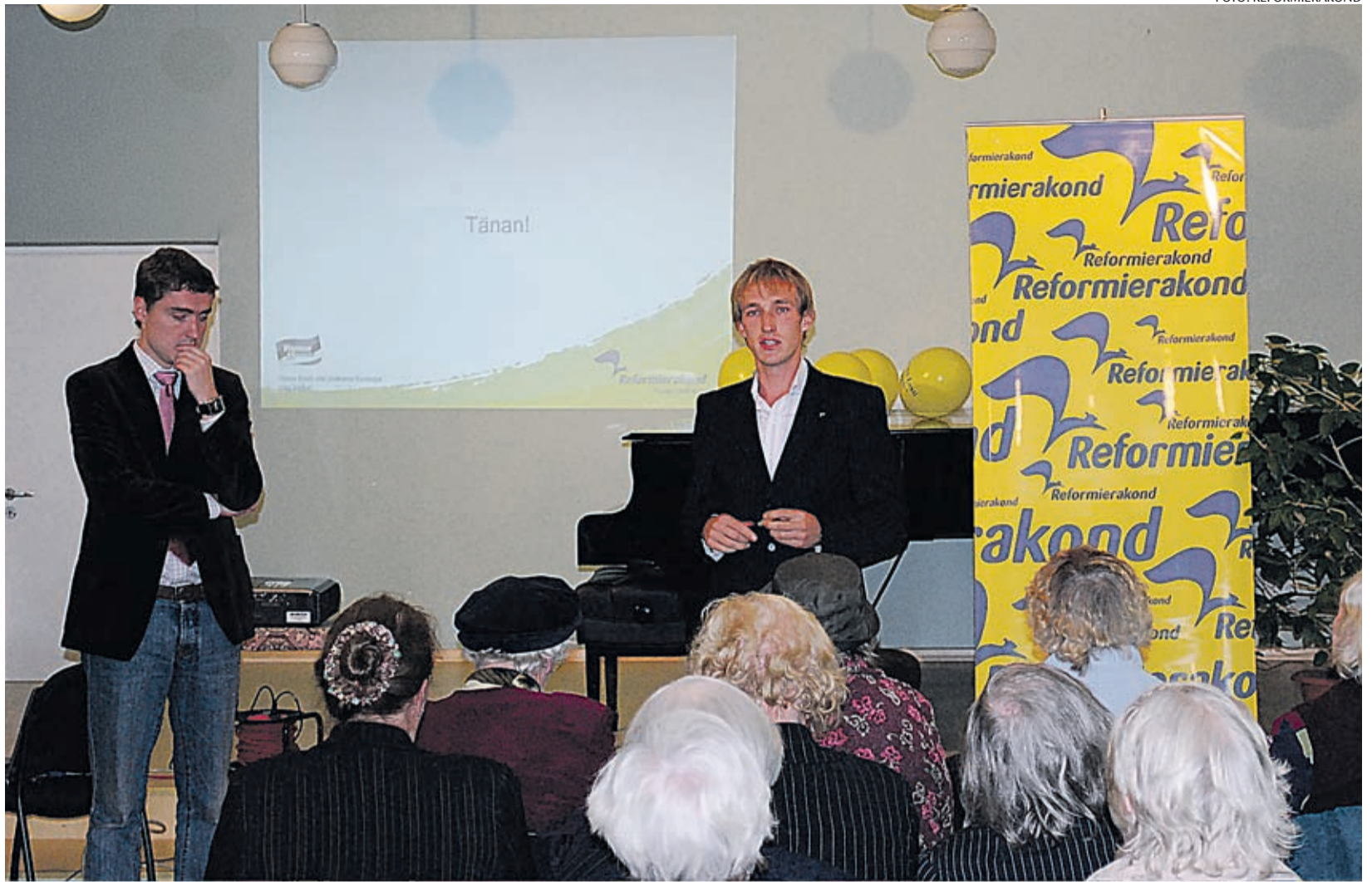
Lauri Luik (paremal) ja Taavi Rõivas selgitasid Haapsalu eakatele, et pensionid suurenevad lubatud tempos.