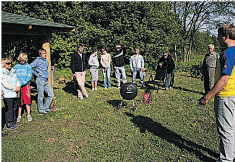
Külaplatsil on inimestel tore koguneda.

Ühes kolleegidega Reformierakonnast seisn hea selle eest, et eelmise aasta sügiseks valmiks meie elanikele oma enda külaplats. Linnapiiri ääres asuval külaplatsil on tänaseks perekiik, katusealune istumiseks, lõkkease ning korvpalliplats. See annab meie inimes-