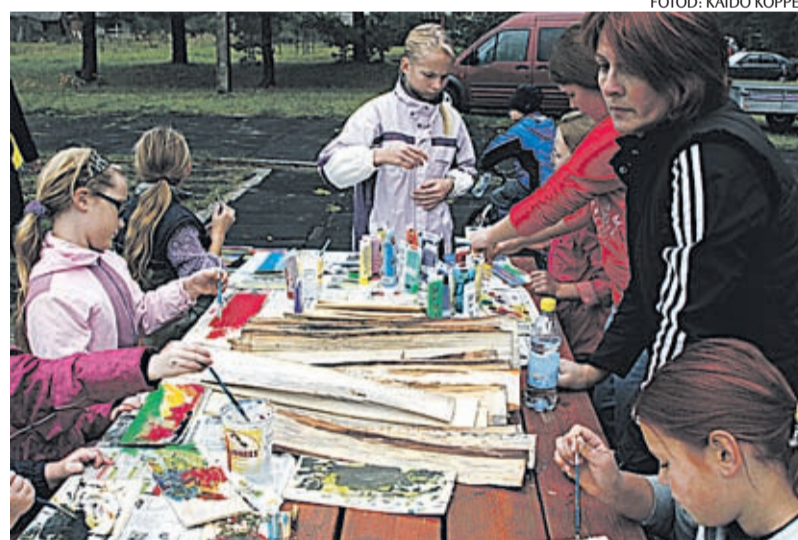
Perepäeva noorimad osalejad nautisid üheskoos joonistamist.

Lapsed proovisid kiirust slaalomrajal ja osavust ning täpsust lendava taldriku