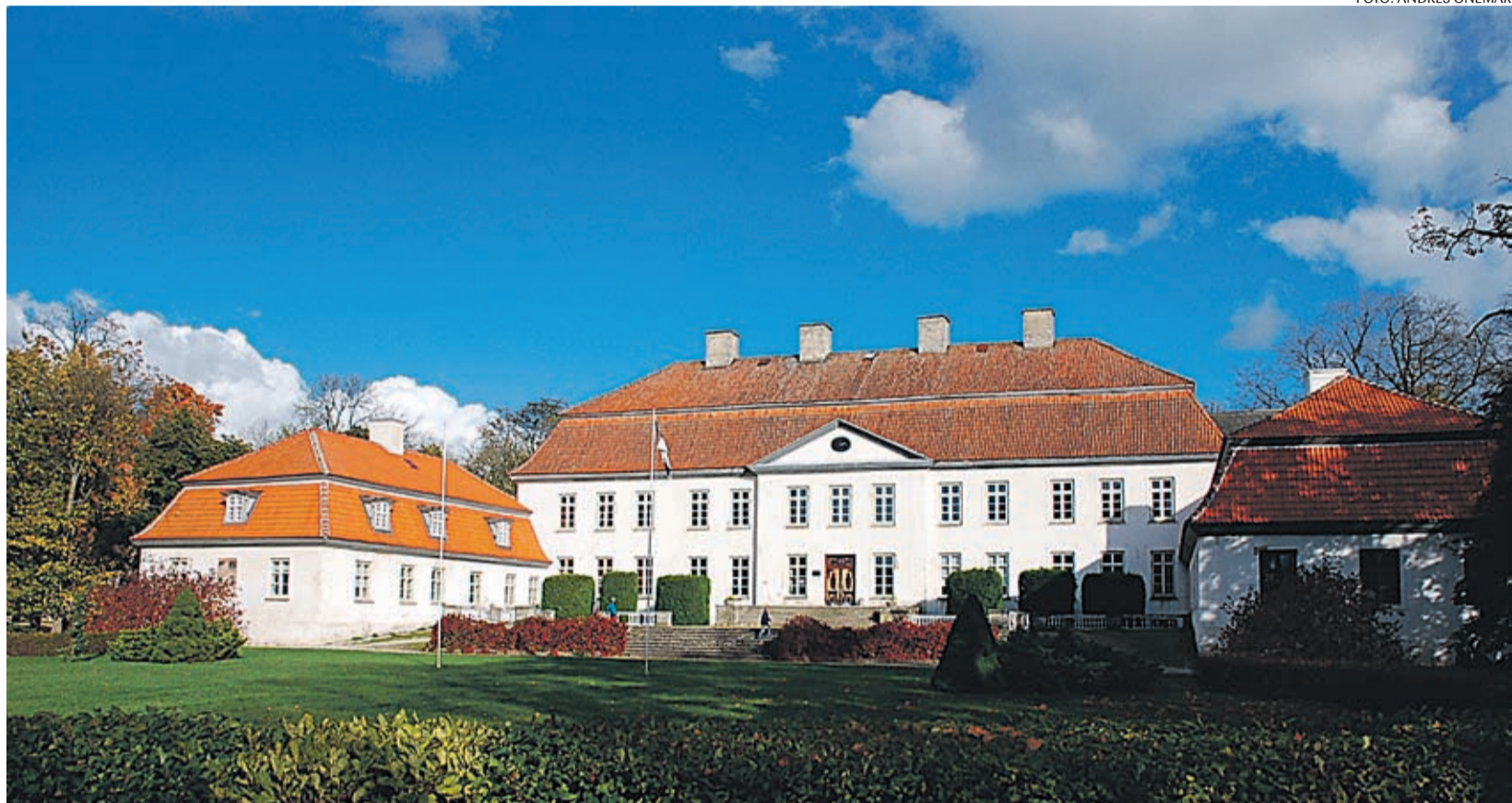
Suuremõisa ajaloolises mõisahoones antav haridus toetab Hiiumaa tulevikku.