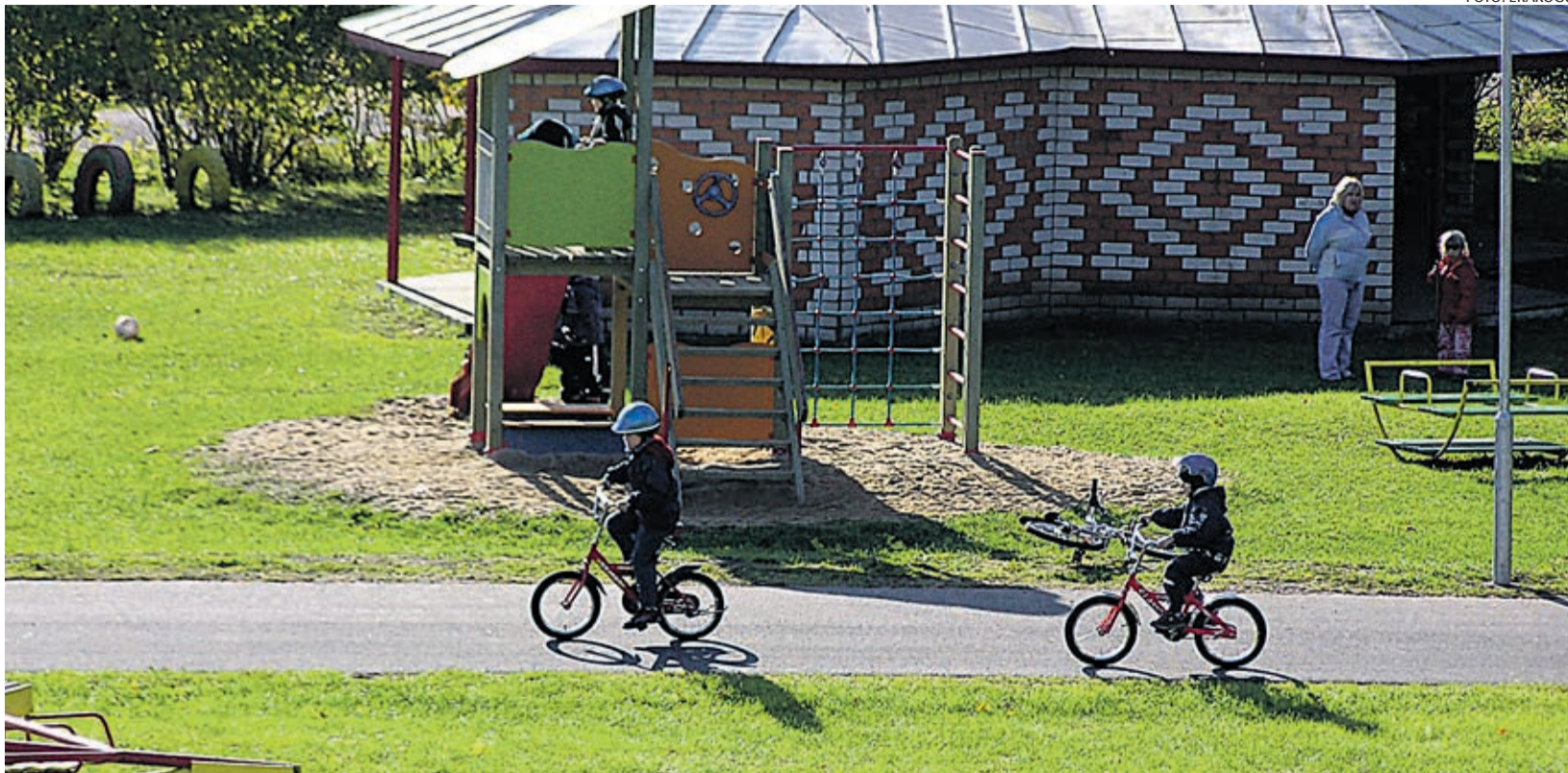
Lastega peredele pakutavatest võimalustest sõltub, kas asula on elujõuline.