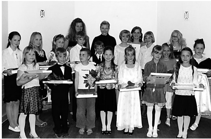
Keeni põhikooli selle õppeaasta parimad vastuvõtul Sangaste lossis.

K eeni kool alustas sügisel 146 õpilasega. Aasta jooksul lahkus koolist 3 õpilast. Üks õpilane läks teise kooli, kaks õpilast said õppeaasta jooksul 17aastasest ja loobusid koolikäimisest, sest koolikohustuse täitmisega tekkisid suured probleemid. Juurde tuli 5 õpilast. Kooliaasta lõpuks on meid 148 õpilast. Tore, et meie valda tuli juurde peresid, kelle lapsed asusid õppima meie kooli.