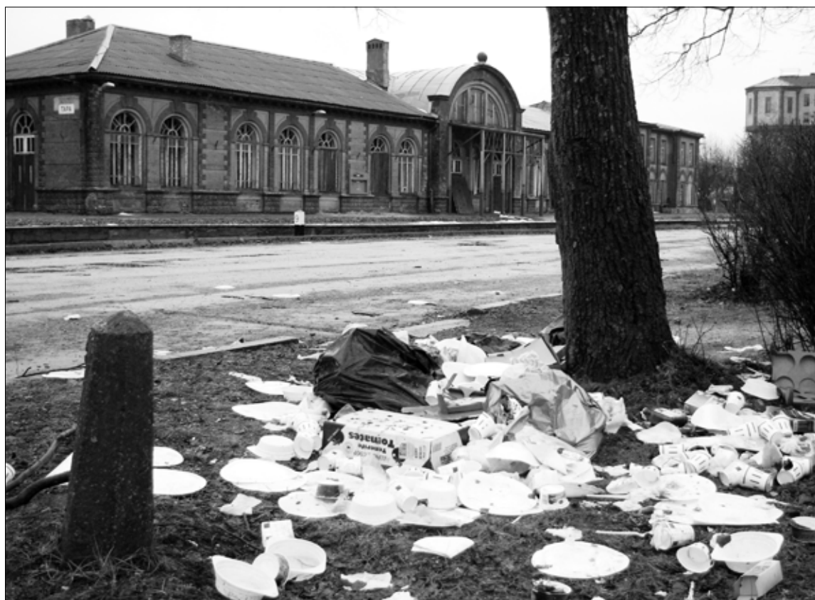
Veel nädal pärast "Detsembrikuumuse" filmivõtete lõppemist võis Tapa vaksali juures näha võttegrupist järelejäänud sorteerimata olmejäätmeid.