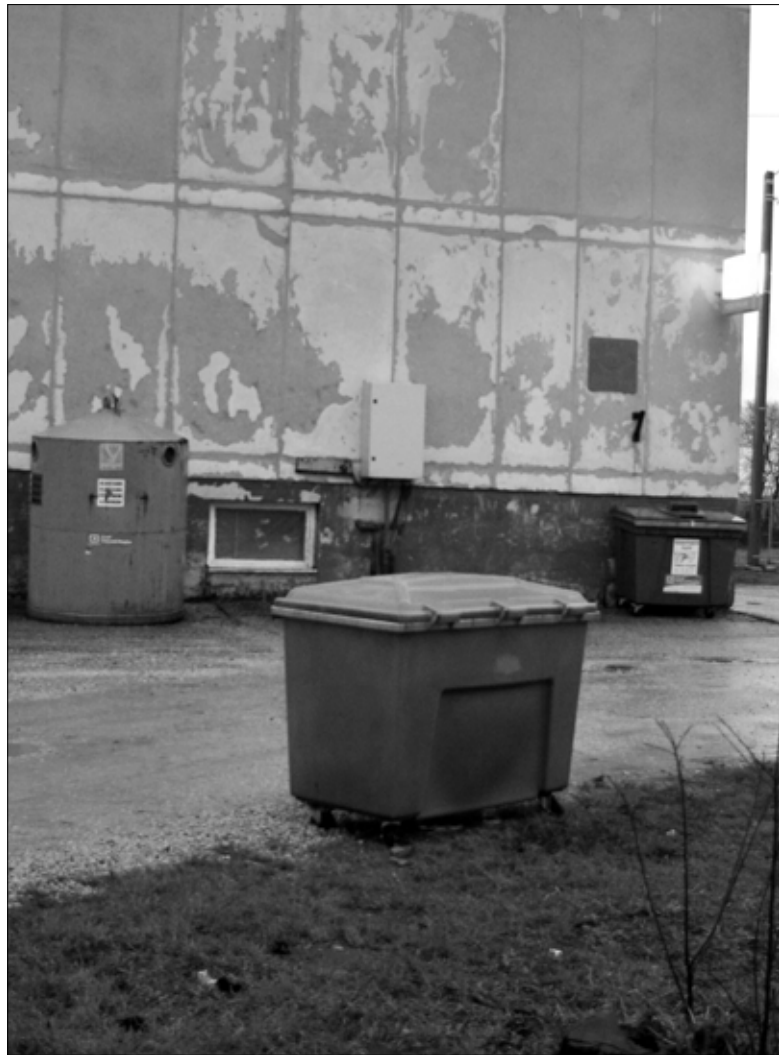
Prügikonteinerid Lehtse side juures.