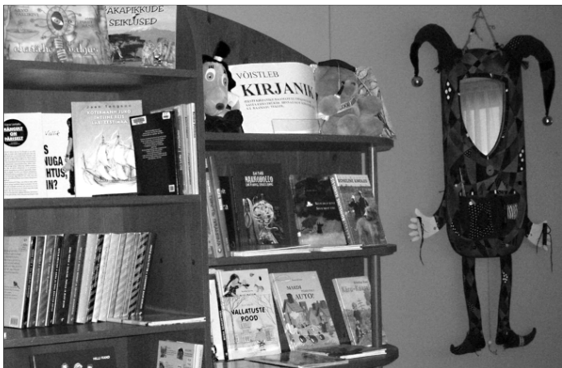
Nukitsa konkurs on Eesti Lastekirjanduse Keskuse poolt korraldatav lugejaküsitlus, kus selgitatakse välja viimase kahe aasta eesti parim lastele kirjutatud ja kaunimalt kujundatud raamat.