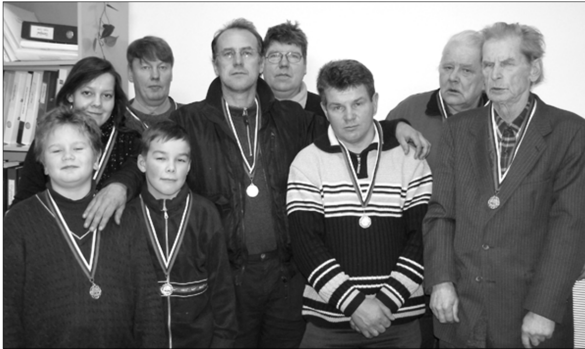
Tapa valla noored ning ka kogenud maletajad ühisel pildil.