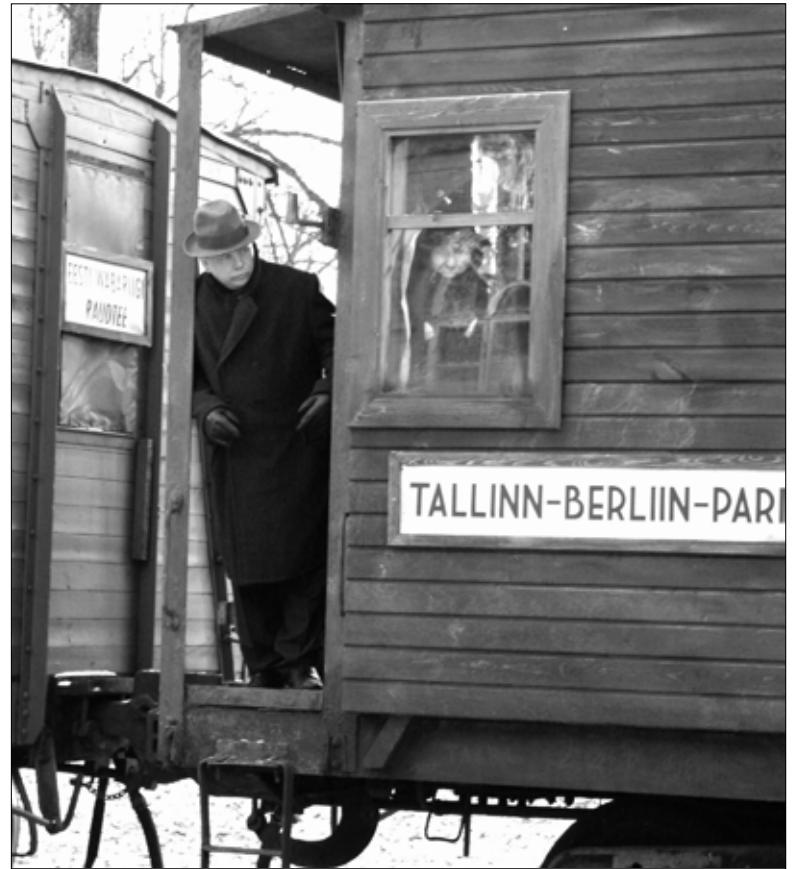
Sellise kirjaga vagunit võis näha Tapa vaksali ees talvistel filmivõtetel. Millal see muutub reaalsuseks, on raske ennustada.