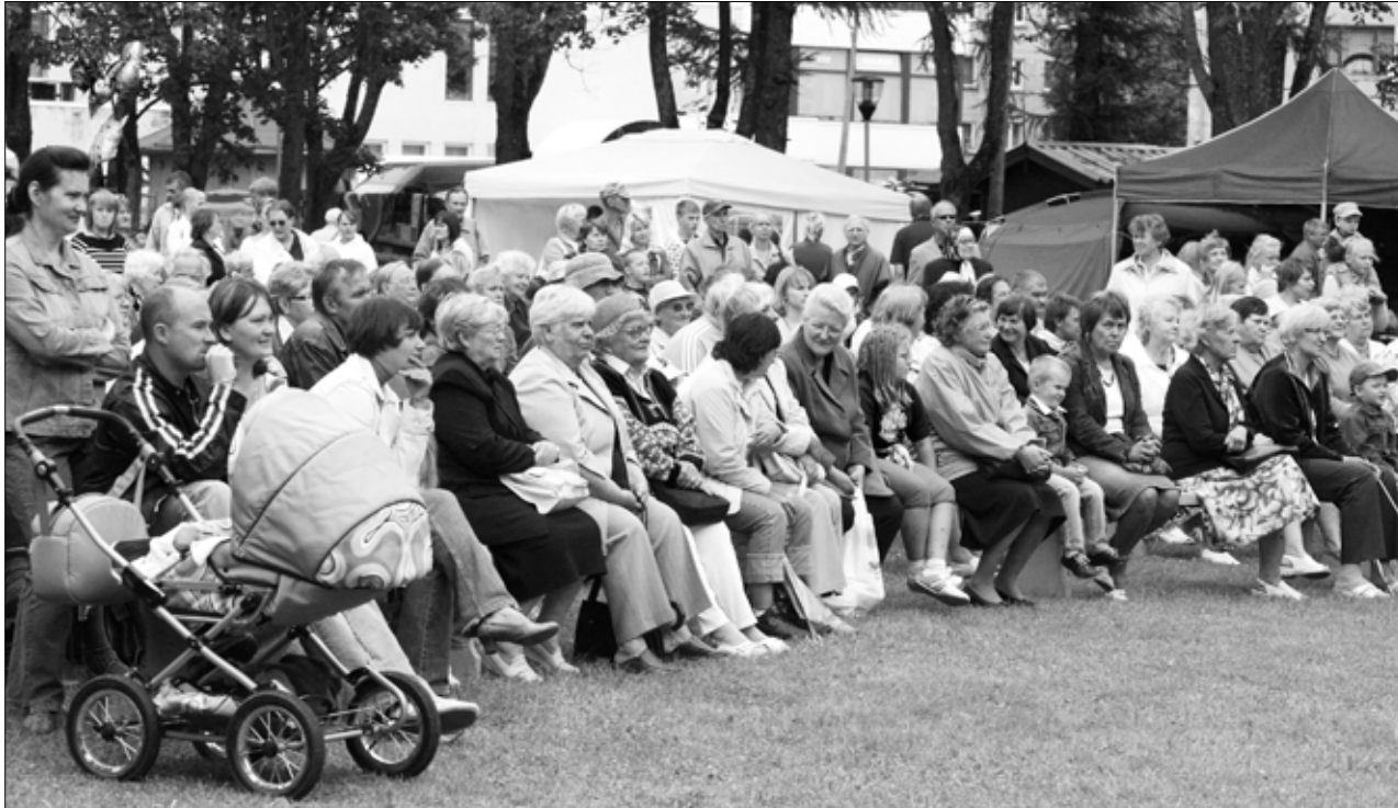
Linnarahvas linnapäevade avamisel.