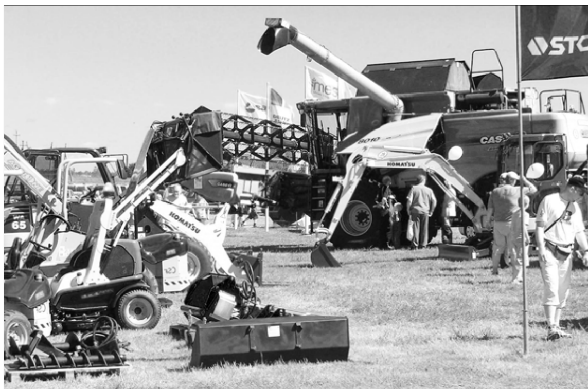
Talupäevadel oli väljanäitusel palju kaasaegset põllumajandustehnikat.