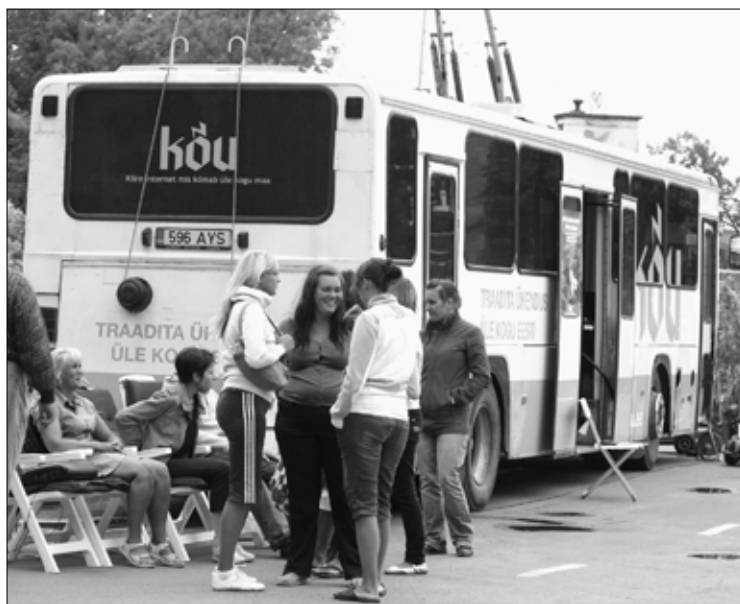
Tapa keskväljakul oli traadita ühenduse trollibuss, mille kõrval sai linnarahvas valutavale seljale leevendust massaažitoolidel.

Laupäevane päev oli meeleolukas ja vaheldusrikas, täis kontserte, erinevaid spordiüritusi ja esinemisi ning näitusi. Järjekordne linnapäevade laot oli seegi kord rahvarohke, samuti meeleolukas konkurss „Tapa linna ilusam krants“ ja „Tapa linna ilusam tõukoer“ (kon-