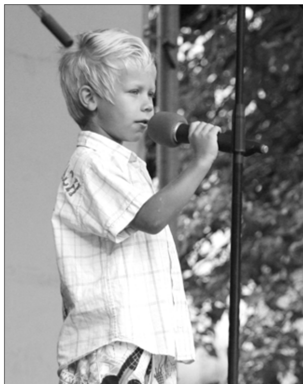
Isetegevuslaste kontserdil esinesid ka Tapa kõige väiksemad laululapsed.