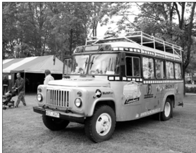
Kinobuss muusikakooli taga.