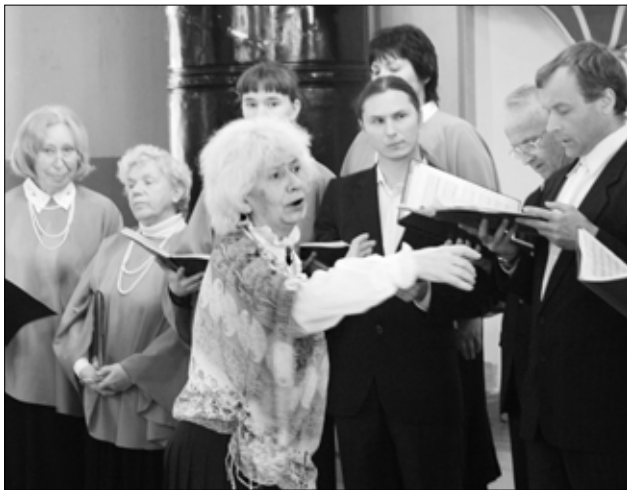
Reedel esines Peterburi koor Tapa kirikus, esiplaanil koori dirigent.