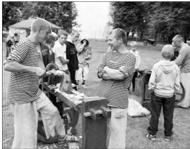
Kinobussiga koos olid Tapal ka lodjakoja töömehed.