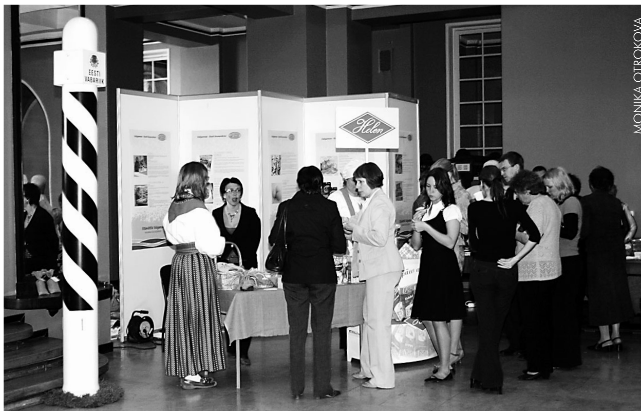
Valgamaa kuu avapäeval tutvustasid Riigikogus oma toodangut meie maakonna ettevõtjad, nende hulgas mitmed meie piirkonna ettevõtjad. Nende poolt pakutava vastu oli suur huvi.

Peaminister rääkis regiooni tervishoiu arengukavast, Valka-Valga ühisbussiliinist, Riia-Valga vahelise rongiühenduse taastamisest ja kinnitas, et kahe linna koostööd on võimalik alati tihendada ja paremaks muuta. Probleemiks on