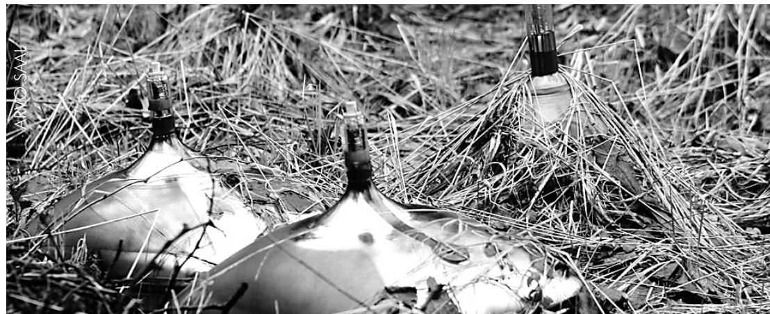
Sellised "lilled" öitsevad Otepää vallas riigimetsas ka pärast koristusaktsiooni.

3. mail koristati ka meie linnas ja külades. Tahan siin tublimeid välja tuua. Kõigepealt tänan