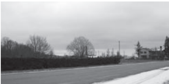
Puhu-Risti söögimaja taga asuv ala peaks mõne aja pärast sootuks teistsugune välja nägema.