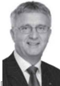
VÄINO LINDE, riigikogu põhiseaduskomisjoni esimees, Reformierakond

Praeguse töölepinguseaduse suurimaks puuduseks tuleb pidada liiga jäika töösuhete formaalse külje ettekirjutamist. Seevastu töötamist üldiselt reguleerivatest printsiipidest räägitakse vähe. Näiteks on kehtestatud töölepingu kirjalku vormistamise nõue. See on üldse eelduseks, et leping kehtiks. Tegelikult on ju tööleping vaid alus töötegemiseks ja nii töötajad kui tööandjad peaksid ühiselt olema huvitatud, et selle sõlmimine oleks lihtne ja vajadusel tagantjärele kergesti tõendatav. Olgu kas või vastastikuse meili- või kirjavahetuse kaudu. Seevastu konkreetsetes töötingimustes peaksid olema töötajale alati kirjalikult esi-