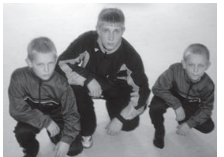
... ja Orionid.