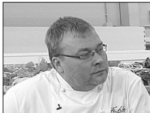
Telekakk tegi Konsumis süüa. Lk 3