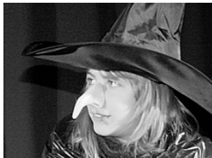
Sinilinnus tehti teatrit! Lk 2