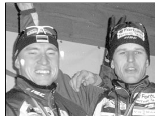
Eesti meistrid – Saue ja Lessing. Lk 6