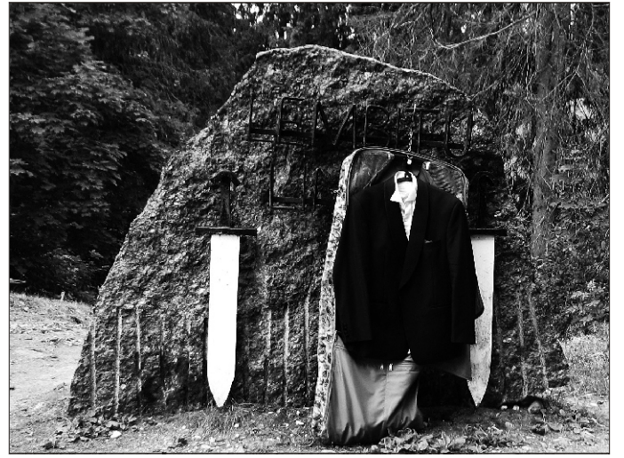
^ RAM-i lauljad jõudsid linnamäele