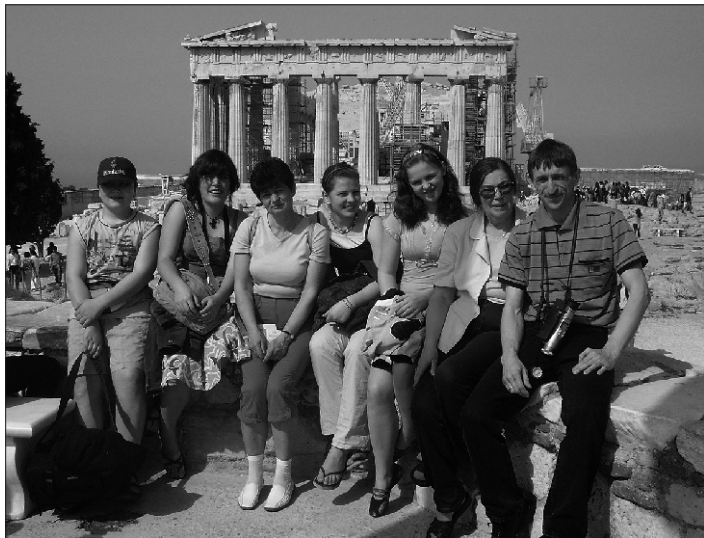
Kogu Kildu Põhikooli reisiseltskond