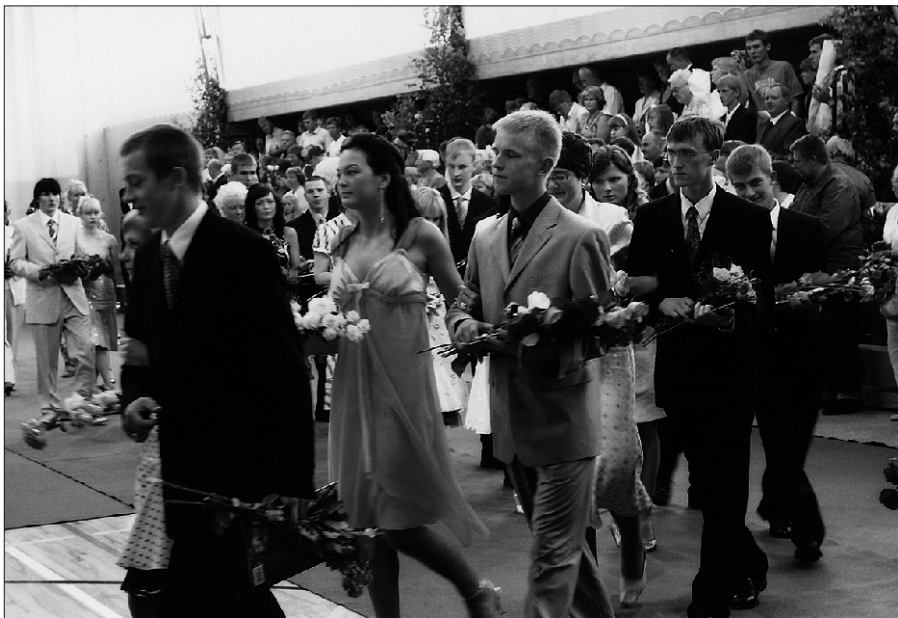
Lõpuaktus Suure-Jaani Gümnaasiumis