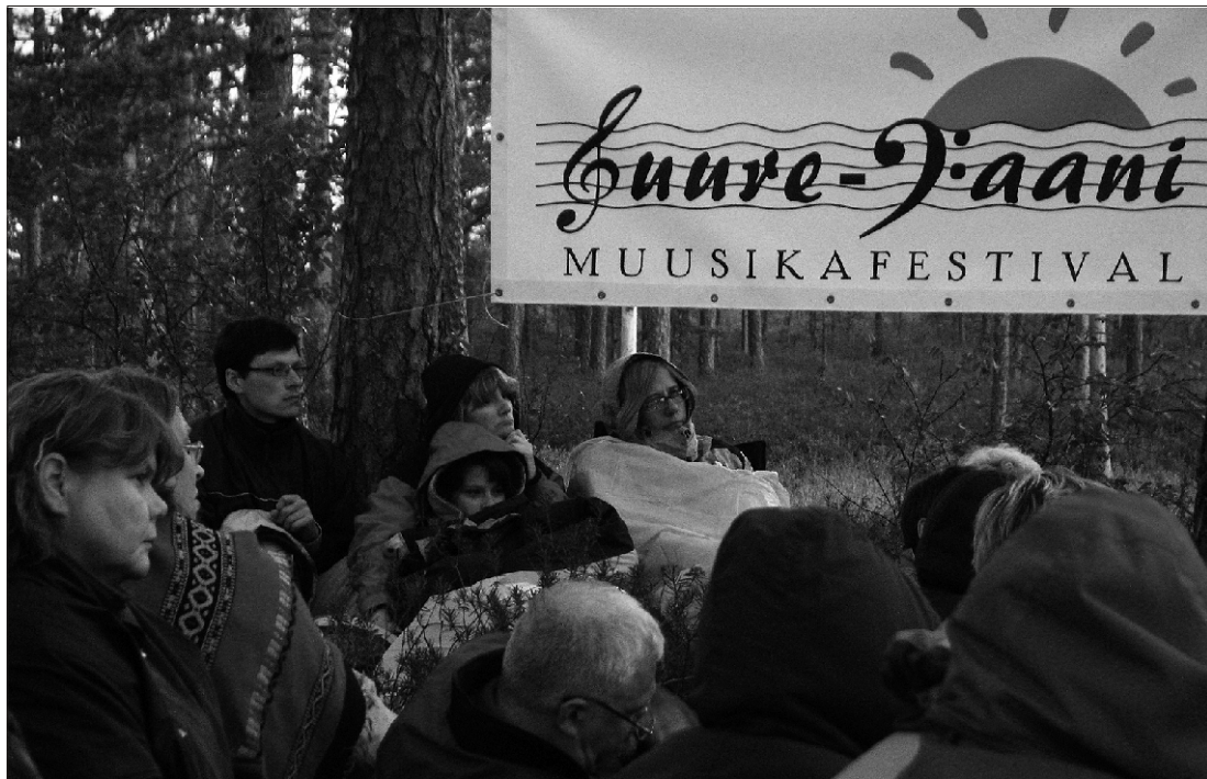
Suveöö jaheduses Hommikumeeleolu kuulamas