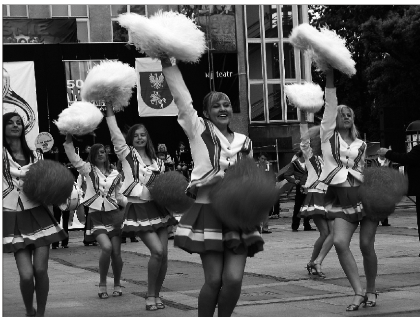
Poola orkestri pilkupüüdvaime osa - tantsutüdrukud.