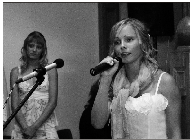
Lõpuaktus Olustvere Põhikoolis