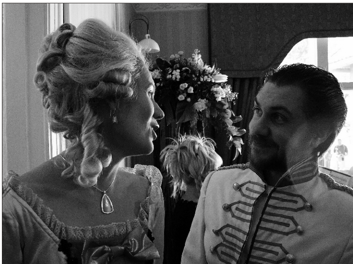
Noored lauljad Teeseldud lihtsameelsuses