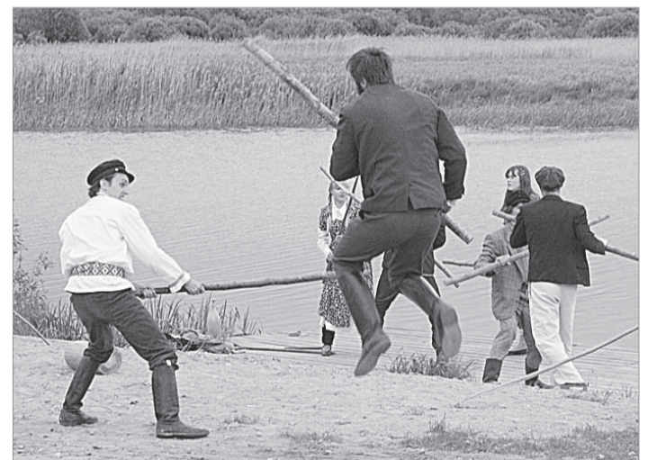
MADIN: kohustuslik kaklus keset etendust.

Tõösõl puul kujutledavat lavva om õnnõ kohvi- ja ruvva-termsõ'. Kohvi lätt üte proovi aoga' nii pall'o, õt tuu pääle kulus ar' suur poolõtõõsõliitrinõ piim. Kohvilavva man lõ-