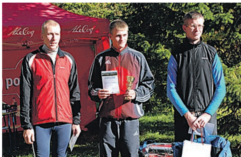
Saadjärve sügisjooksu võitjakolmik.

järve ümber kulgenud jooksuraja distantsi pikkuseks on 18 kilomeetrit. Rada sai läbida nii joostes kui kõndides. Esimesel üritusel oligi kohal nii jooksjaid kui kepikõndijaid. Kooli