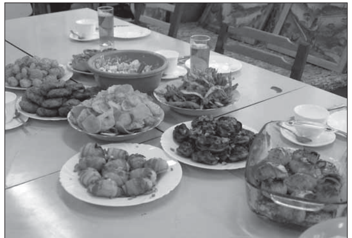
Teeme süüa ja sööme.