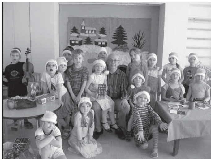
Näitetrupp koos näitekirjanikuga.