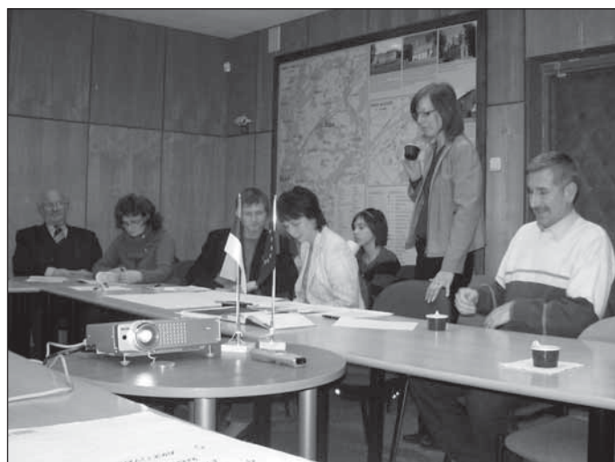
Seminar Nõo vallamajas.