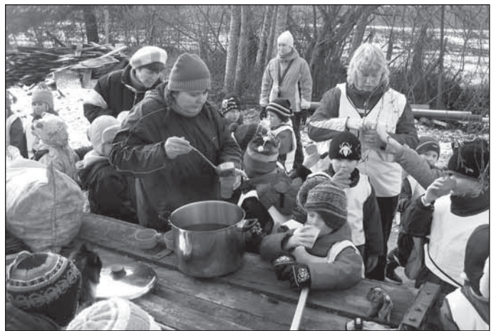
Vastlapäeva tunnet saab tekitada ka lumeta.