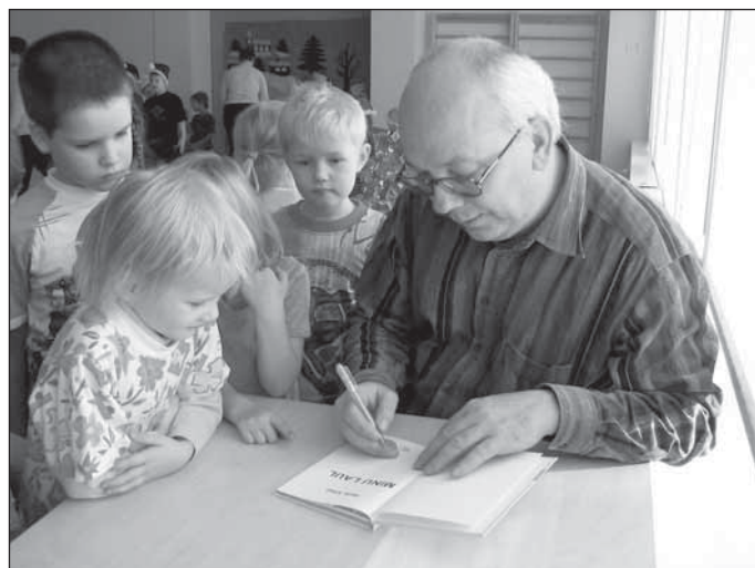
Kirjanik jagab noortele lugejatele autogramme