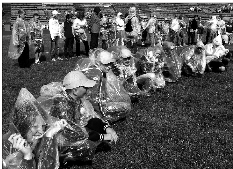
Tantsupeoline trotsib nii vihma kui päikest