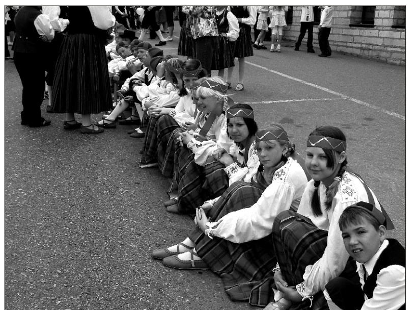
Rongkäigu ootel &gt;