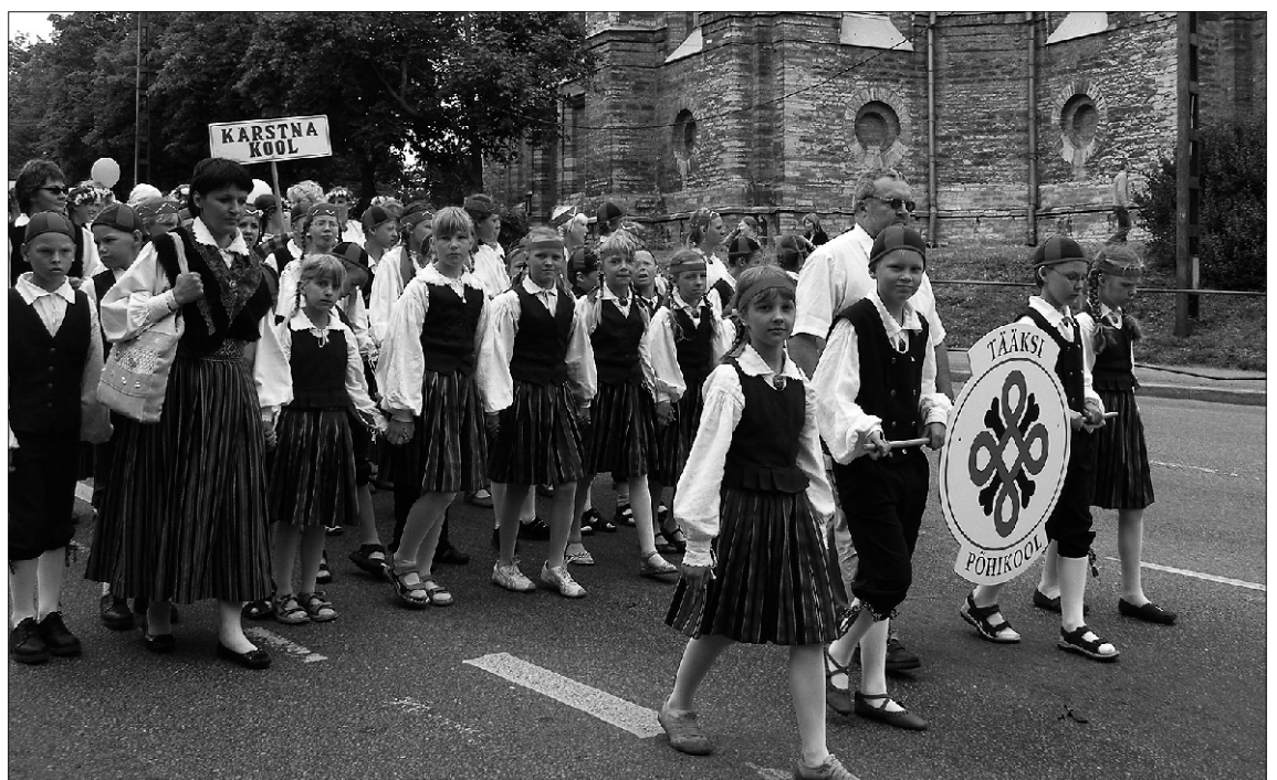
Täaksi lapsed rongkäigus