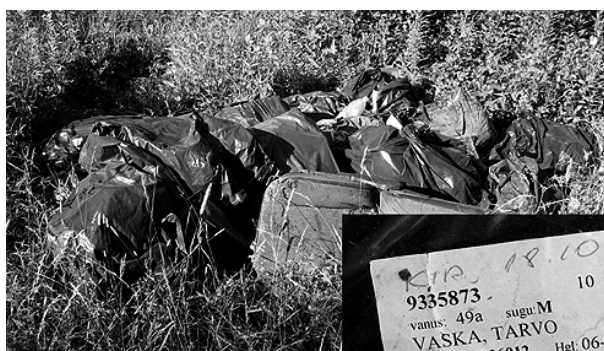
Looduskaunis kohas leitud hunnik prügi - „visiitkaardidki“ küljes.