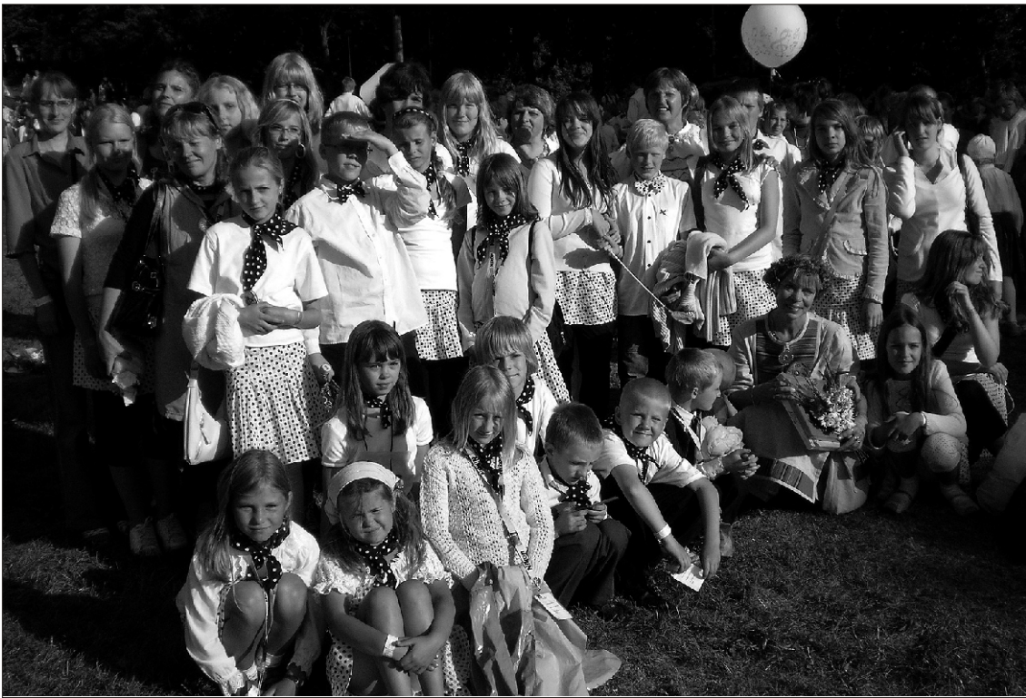
Kildu kooli laulurahvas