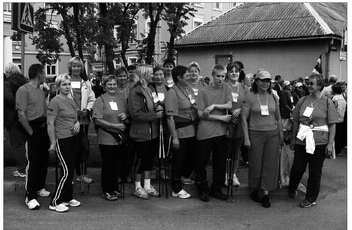
Hetk enne rongkäiku