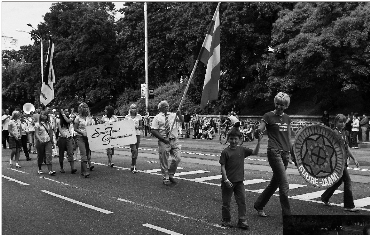
Suure-Jaani vald 1. juulil Tallinnas Noortepeo „Ilmapuu lävel” rongkäigus.