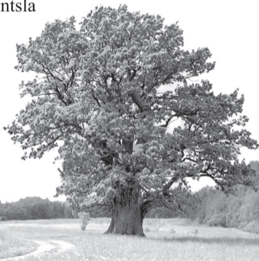
Tammõ-Lauri tamm Urvastõn.