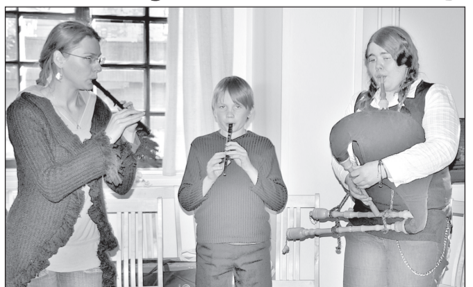
RAHMANI JANI PILT

Roose Celia kuts kooli mano kõiki väikeisi rahvapilliuhuviliidsi: 2. ja 3. piimäkuu pääväl (2.–3.06) omma muusigakoolin vahtõ katsmisõ.