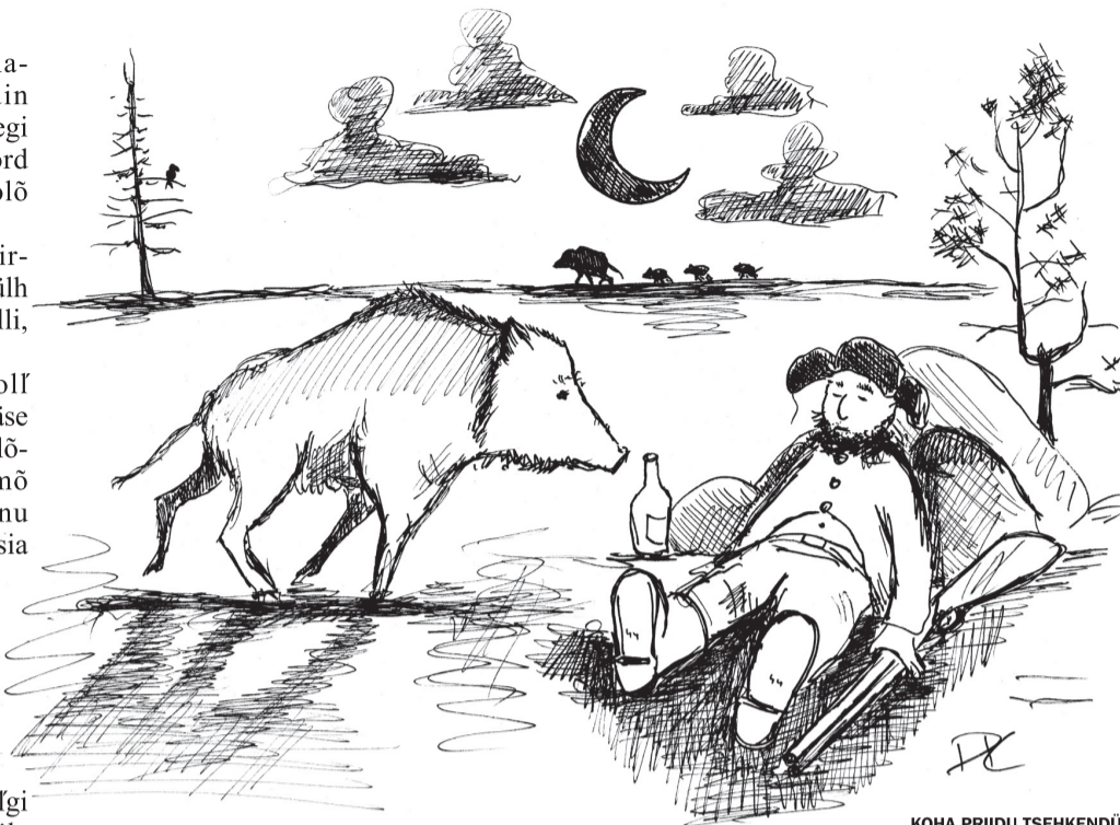
KOHA PRIIDU TSEHKENDÜS

Pia läts külh peris külmas. Hanša olf kah kõva, ja nii Ott suigahki unõõ. Mõtstsia tulli külh nurmõ pääle, a Ott norsas nii kõvva, et nä pia Lätimaalõ pagõsiva. Ott heräsi jo sõs,