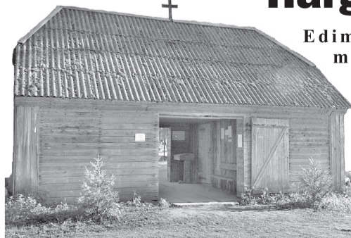
Harglõ kalmuaia käärkambri (tan muumiat ei olõ!).

Edimäne nimmamine 1694 (löödi Koivaliina kihlkunnast eräle).