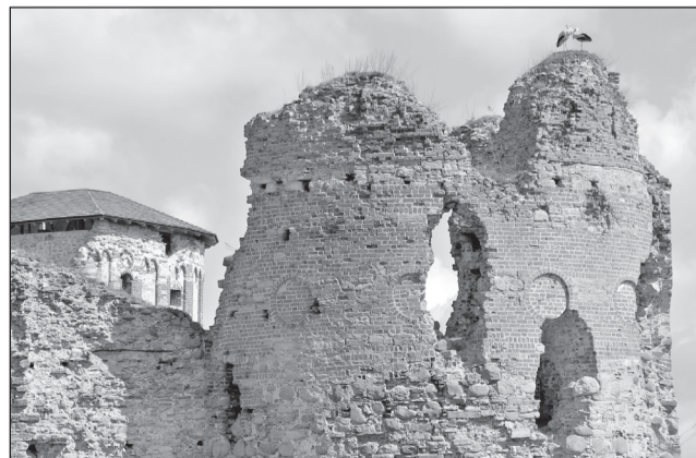
Toonõkurõ Vahtsõliina kandsi müüre pääl.