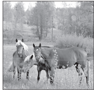
Rõõmu talo hobõsõ Kolskin.