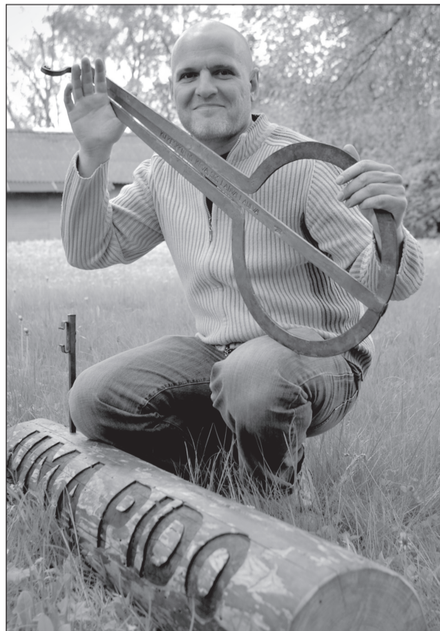
HARJU ÜLLE PILT

Tagamõtsa Tarmo Uma Pido tunnismärgi, sepä tettü parmupilliga.