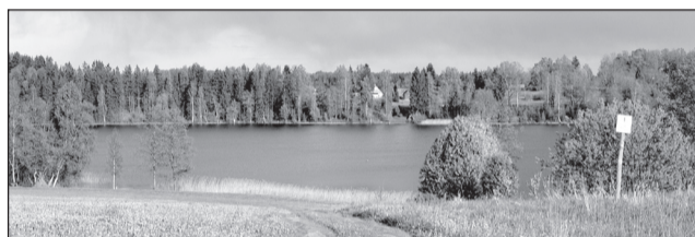
Piigandi järv – üts ilosist Kanepi kihlkunna järvist.