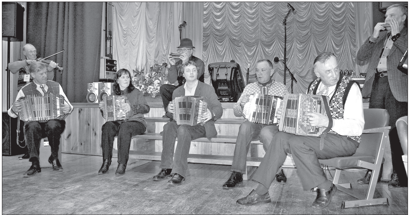
HARJU ÜLLE PILT

Küläpillimehe (ja üts naanõ) Oravil küläpillimihi pääväl ütenukuun g-duuri lukõ mängmän.