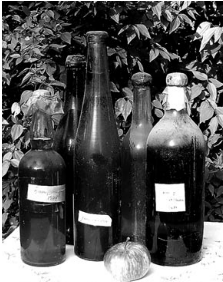
Vana keldri aarded, unustamatud aastakäigud.

Õhtul pane mahl ja suhkur pudelisse ning säti käärimistoru peale. Toru peab saama pudeli peale õhukindlalt. Kuidas? Tuleb teile ette nõrdinud jõmpikas, suu kõver kui kapsaraud, vanemate käest aru nõudmas: «Iss, sa oled JÄLLE kõik mu plastiliini hakkama pannud! Isegi selle helesinise!»