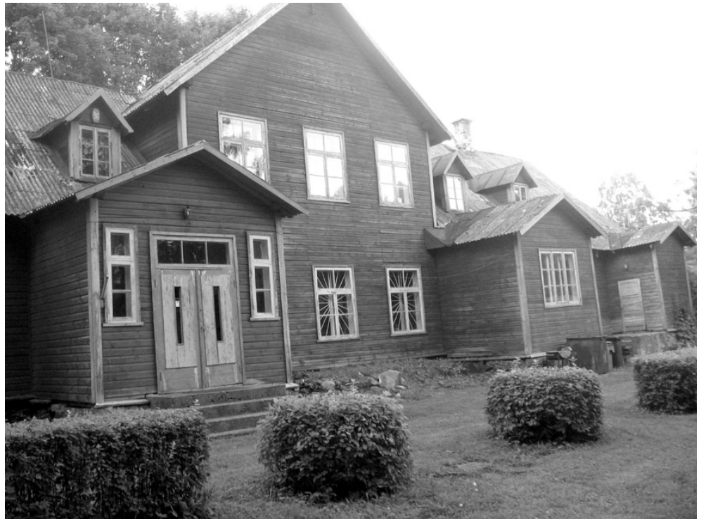
Praeguses, üle saja aasta vanuses hoones tegutses pärast kooli sulgemist 1973.

Uderna kooli lugu on üsna pikk. Teda on mainitud juba aastal 1766. Jääb arusaamatuks, miks Udernas leiti vallamaja ja kooli asukoht mõisast ning ka meti sobivamast Kalmest eemale. Minu teada olnud koolimaja esialgne asukoht praegusest majast veidi kirde pool kõrgendikul, mis hiljem osutus aiaks. Kui aga suitsutarena ehitatud maja kitsaks jäänud, ehitati nüüdse hoone kohale uus ja jätkati 1896 venekeelse ministeeriumikoolina. Ent sellel polnud pikka iga. Sajandivahetusel põles koolimaja ühe õpetaja samovarist pääsenud sädemest maani maha. Sündmusest on hiljem kirjutatud mälestustes toonane koolipoiss Friedebert Tuglas. Uus kooli-