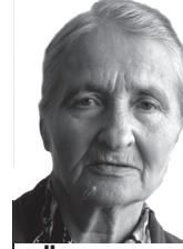
LÜBECKI HELVE, Orava kandi tundja

Tõõnõ sääne oppaja tüü kõrvõlt tegemine om mul Piusah turistõ juhtminõ. Tuud olõ kah tennü üle katõkümne aastaga. Taa tüü man putut kokko hulga inemiisiga ja nimõ kõikõ omma olnu väega torõda ja hää inemise. Esieränis pallo turistõ olf minevõaasta ja ka seo aasta. Sai jo valmis vahtõnõ kaemisplat-