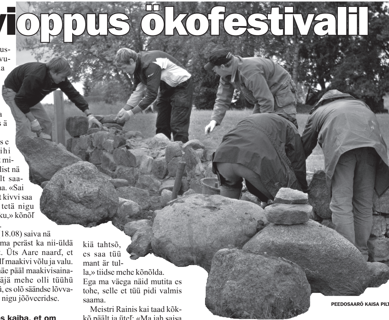
PEEDOSAARÕ KAISA PILT

Meistri Rainis kai taad kõkkõ päält ja ütelf: «Ma jah saisa niisama, käe karmanin: ma iks ummi kässi külge ei panõ.» Taad ütelf meistri jäl nafa peräst – tegeligult käreof tä sääll kivve, vidi seku, liiva ja muud.