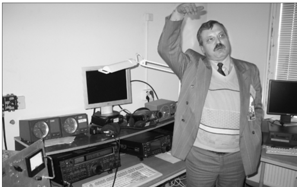
Toomas, ESSRY näitab, et Low Poweris tuleb vahel ka kõrgelt lennata