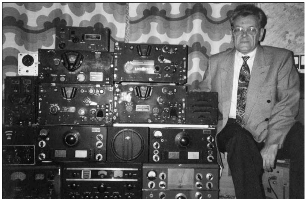
UA2AO ja osa tema kollektsoonist