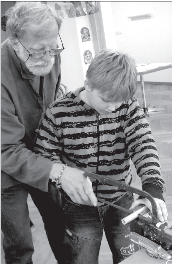
PARHOMENKO EDUARDI PILT

Minevä puulpäävä Põlvan peetül suurõl käsütüü- ja kunstipääväl oll' esieräliidselt pallõ märgitü latsi pääle.