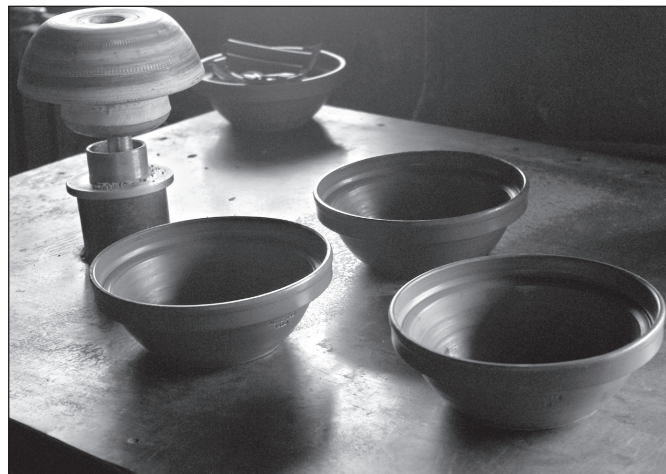
Tsooru potitehassõ setopoti...