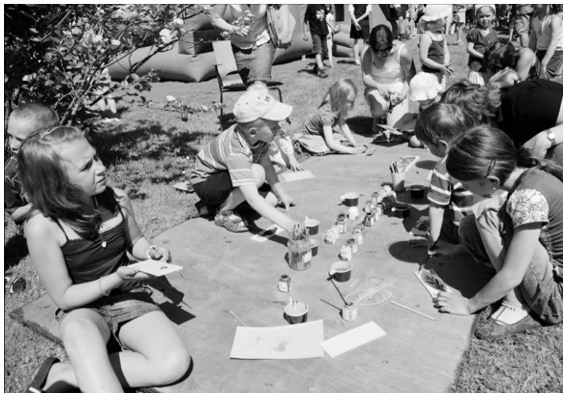
1. juuni korraldasid MTÜ Tapa Lastekaitse Ühing koos vallavalitsuse ja kultuurikojaga Tapa Laste- ja Noortekeskuses lastekaitsepäeva.