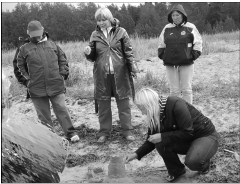
Lasteaednikud rajasid Vainopea liivasele rannale oma kodukohta sümboliseeriva ehitise.