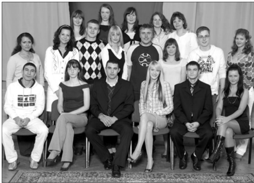
TVG 12. klassi lõpetajad 2009. aastal