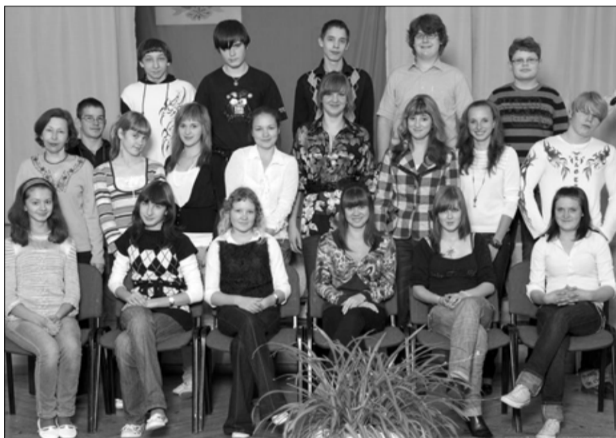
TVG 9. klassi lõpetajad 2009. aastal