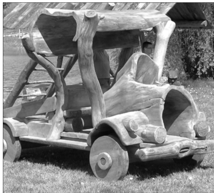
Laadaliste pilke köitis ka suur puidust auto.